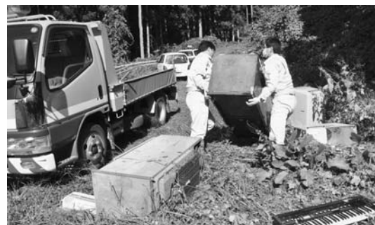
東岳地内の林道に不法投棄された廃棄物