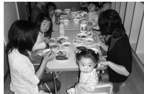
保育所のお友達と楽しく給食を試食しました

はしを正しく持つには、スプーンを正しく持つことから始まり、下から鉛筆を持つ時のような持ち方ができるようになったら、はしもスムーズに持てるようになります。焦らず、褒めながら、少しずつ進めるようにしましょう。家とは違う雰囲気の中、いつも