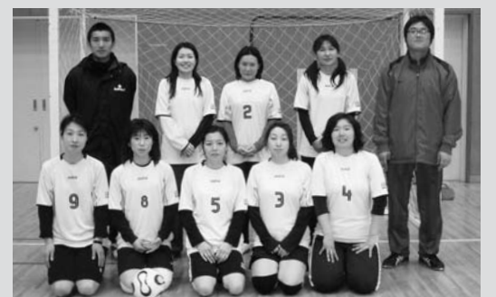
準優勝した平泉FCママーズのメンバー

第3回げいびカップフットサル大会(東山サッカー協会主催)が2月14日、一関市の東山総合体育館で開かれ、当町から参加した平泉FCママーズがレディースの部で準優勝を収める快挙を成し遂げました。 同チームは初戦で昨年度優勝チームを2-1で破ると、波に乗り予選リーグを全勝で通過。決勝では中里フレンズと白熱した試合を展開しましたが、体力で勝る相手に惜しくも1-2で敗れました。 ママさんたちは、3月に行われる大会での上位入賞に向けて練習に励んでいます。