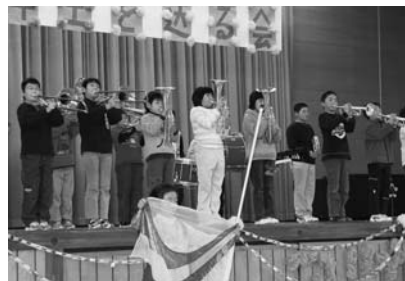
合奏団デビューの4年生

せる出し物なのですが、4年生だけは、特別な発表をしています。それは、合奏団としてのデビュー演奏なのです。1カ月前ほど前から、朝、業間、昼休みと時間を見つけては個人練習に励み、来年の合奏団は大丈夫と6年生に認めてもらうように頑張ってきたものです。 当日は、緊張の中の演奏でしたが、アンコールを求められての2回目は、打って変わって自信に満ち