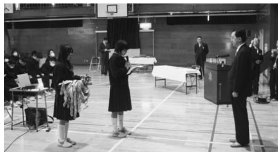
知事による「出前授業」の様子

3月14日(土)、男子41人、女子35人、計76人の生徒たちが、学舎を巣立ちます。 義務教育9カ年の間、地域の皆さまには大変お世話になりました。ありがとうございます。 卒業後も地域の一人として、町民の皆さまからの励ましをよろしく願っています。