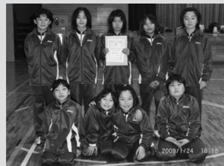
準優勝した平泉バレースポ少のメンバー

第19回めんこいテレビ杯小学生バレーボール大会一関地区予選が1月24日、一関市で開かれ、当町の平泉バレースポ少が大活躍しました。 予選リーグを2戦全勝で通過した同チームは、準決勝でも滝沢チームに2-0のストレート勝ち。決勝では興田チームに惜しくも敗れましたが、準優勝を勝ち取りました。