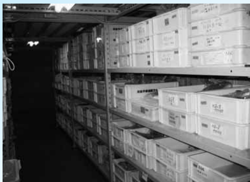
郷土館地下の収蔵庫