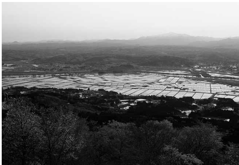
◀駒形峰からの眺め。自然美の浄土「平泉」は、この地をきよらかにすることによって現れた。これからのまちづくりで平泉は輝きを増す。

清衡が中尊寺の建立に当たって「法華経」をよりどころにしたのは、その教えは都の人にも、みちのくの人にも、動物にさえも平等に及ぶという、徹底した「平等主義」にあったからでしょう。世の中に差別や侮蔑がある限り、収奪や争いがなくならないことを、清衡は不幸な前半生から痛感していたのです。「平泉