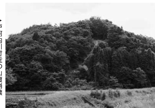
▶戸河内川付近の山腹崩壊