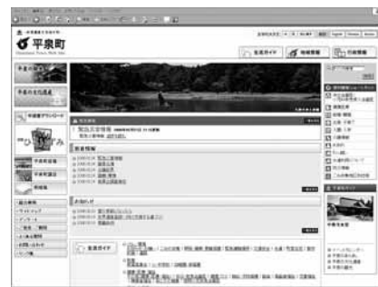
4月にリニューアルした町ホームページ

HPアドレス… http://www.town.hiraizumi.iwate.jp/