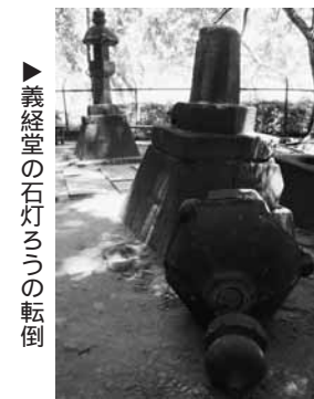
▶義経堂の石灯ろうの転倒

6月14日8時43分ごろ、東北地方を中心に強い地震がありました。震源は岩手県内陸南部で、地震の規模はマグニチュード7.2と推定されたこの地震は、当町で震度5強の強い揺れを記録しました。 町内では地震の影響により、避難途中で1人が転倒、右ひざを骨折する重傷を負いました。住家や土蔵の数棟で、壁や屋根の一部が崩落。町道2路線、林道1路線が、落石などで通行止めとなりました。町災害対策本部がまとめた被害総額は6月25日現在で約1170万円です。 町内文化財の地震による被害は幸い、軽微なもので済みまし