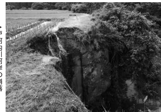
▶戸河内川河岸の崩落