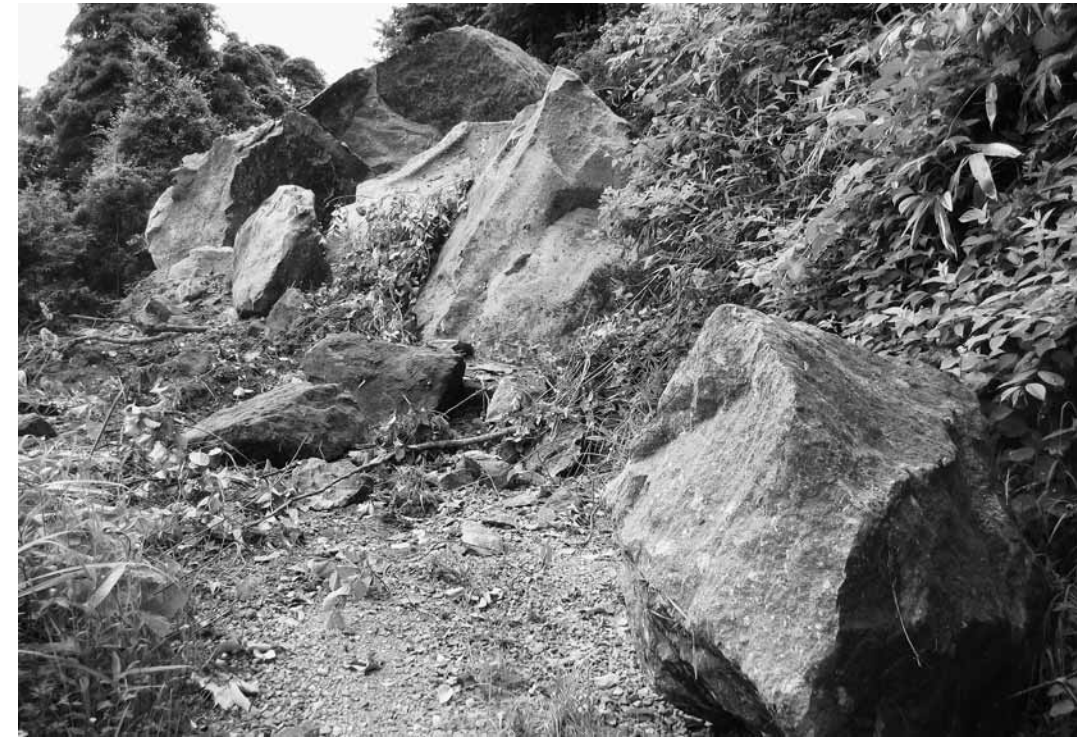
町道南郷線では大きな岩が崩れ落ち、道をふさいだ