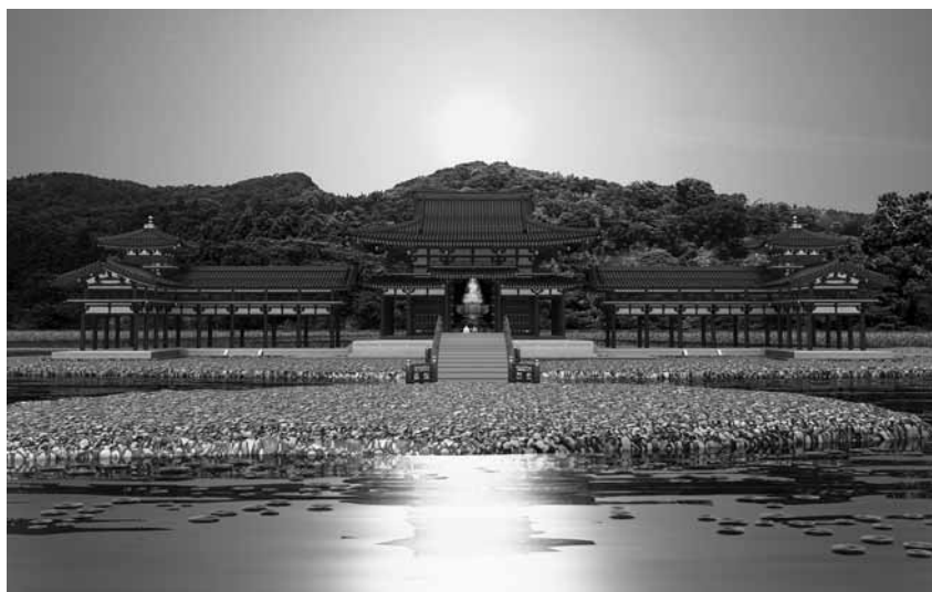
▲無量光院の夕景(復元CG)。背後の景観を取り込んだ無量光院は、浄土式寺院の完成形として高く評価されている。

5月23日、イコモスは「平泉—浄土思想を基調とする文化的景観」について、登録延期を勧告。日本政府は世界遺産委員会での逆転登録に向けて、全力で取り組みます。平泉文化を象徴する言葉として選ばれた「浄土」について、引き続き解説していきます。