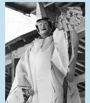
▲中尊寺古実式三番「若女」