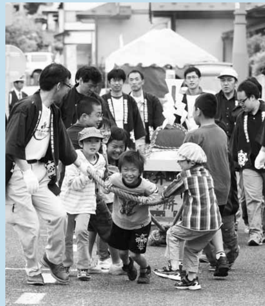
▲町内小学生が競った弁慶力餅そり引き大会