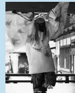
▲毛越寺延年の舞「老女」