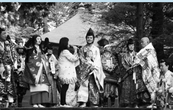
▲中尊寺で行われた主要役者セレモニー