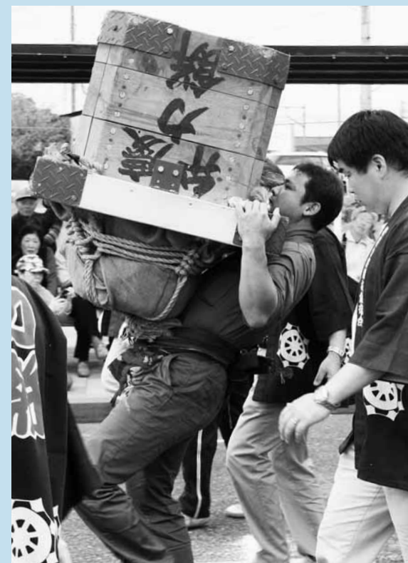
▲18人が力自慢を競った弁慶力餅競技大会