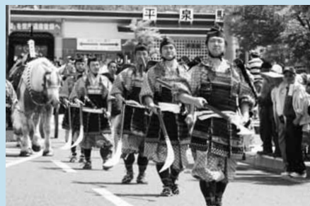
▲りりしい姿の秀衡家巨鎧(よろい)武者