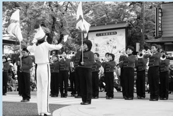
▲本行列で演奏した長島小合奏団