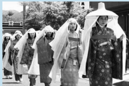
▲あでやかな藤原家侍女の一行