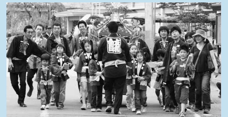
▲元気な掛け声で町内を練り歩いた12区友和会子ども神輿(みこし)