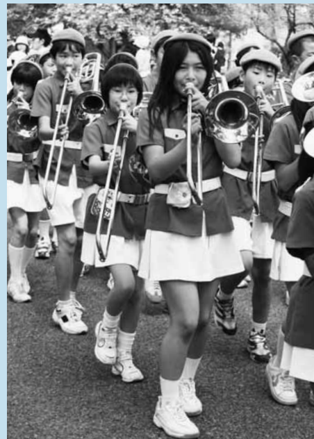
▲出迎行列で演奏した平泉小金管バンド