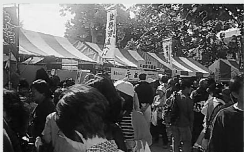
江東区民まつりで大にぎわいの平泉コーナー

「バザール」のコーナーの中に、各県・町村名の「のぼり旗」を掲げて、その郷土の特産品を持ち寄って、PRの呼び声も高らかに、絶え間ない大勢の来場客への即売に追われていました。 平泉コーナーには、国家金色堂のテレカをはじめ、東福りんご、平泉りんごジュース、清酒関山、三代味噌と、漬物各種や平泉産の野菜。そして、平泉駄菓子類と弁慶力餅などの銘菓。そのほか、脱臭剤の竹炭・木炭も陳列販売。特に、飛ぶように売れていたのは、その場で食べられる温かい「いもの子八斗汁」300円。