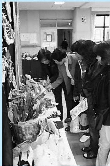
▶数多くの芸術作品が並んだ公民館まつり