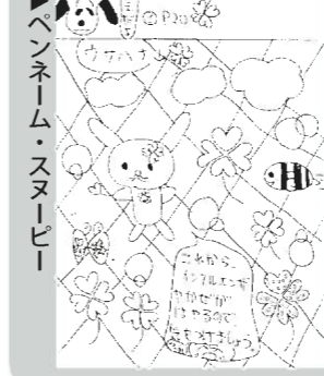
イラスト コーナー