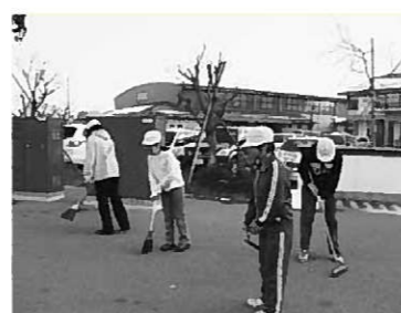
校門前の歩道を掃く6年生

地域清掃活動 クリーン作戦 本校では、月1回「地域清掃活動クリーン作戦」を実施しています。これは環境教育の一つとして、ごみという視点から地域の環境に意識を持たせ、自分たちの町をきれいにするための小さな取り組みとして8月から行っているものです。 ◎対象学年 3、4、5、6年の各学級1班(合計約30人)