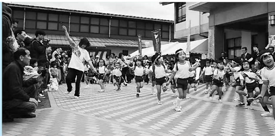
▲文化祭の幕開けを飾った長島保育所園児の踊り