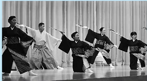
上ステージでは多彩な芸能が披露された。左各出店に行列ができた商工業まつり