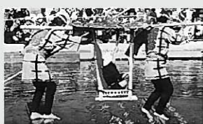
江東民俗芸能「木場の角乗」

「ワダン、瀬原の出身です」「オレの田舎は、達谷だよ」と、江東区民や、ふるさと平泉会の会員などの買い手と、平泉町民の売り手との交歓の中で、あつという間に売り切れが続きました。 21日、広場中心の池では、江東区民の民俗芸能の「木場の角乗」が披露され、水に浮かべた角材に乗る数々の芸能に拍手が贈られていました。