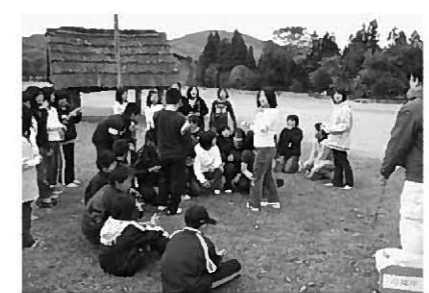
御所野遺跡で開いた交流会

町内小学生が町外の児童と交流を深め、宿泊研修を通して社会性を身に付ける少年リーダー養成事業「きらめきリーダー研修」が11月10日、11日の2日間、一戸町と青森県八戸市で行われました。 平泉小14人、長島小2人の児童が参加。初日は一戸町の一戸南小学校を訪れ、同小が力を入れる文化財愛護少年団の取り組み事例を学びました。世界遺産登録を目指す同町の御所野遺跡で交流会も開き、工作体験などを通して友好を深めました。 2日目は、八戸市が世界遺産登録を目指す史跡・根城を訪問。観光ガイドの案内で遺跡の保護・復元整備状況を見学しました。 2日間の研修を通して、児童らは交流の楽しい思い出を持ち帰り、文化遺産の価値や保護の重要性について理解を深めていました。