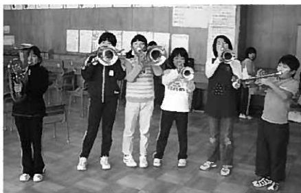
受け継ぐ合奏団活動

バンドの大会には出場していませんが、演奏形態としてマーチングもやっていますのでフォーメーションの練習も欠かせません。吹奏楽祭が終了してからは、来年度に向けて4年生の練習が始まりました。5年生が先頭に立つのはもちろんですが、ここで伝統的に6年生が陰に陽に指導に加わっています。全員が合奏団で活動することには難しさがあるのですが、受け継がれる者と受け継ぐ者と