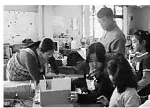
図書館の仕事を学びました

児童は、借りる順序を教わりながら自分の番号を間違わないようにカードに記入して借りていました。