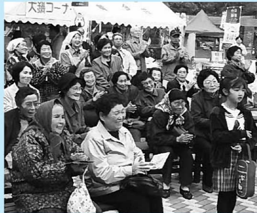
▲会場には延べ5200人が来場。イベントや出展作品の観覧などを楽しんだ