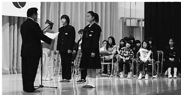
平泉ユネスコ協会絵画展の表彰

町民の皆さんが丹精込めて作られた作品の中から、次の方々が表彰されました。おめでとうございます。（紹介は敬称略）