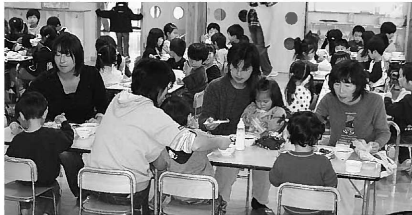
子育て支援センターで給食試食会を10月に行いました。園児たちと一緒においしい給食を食べました