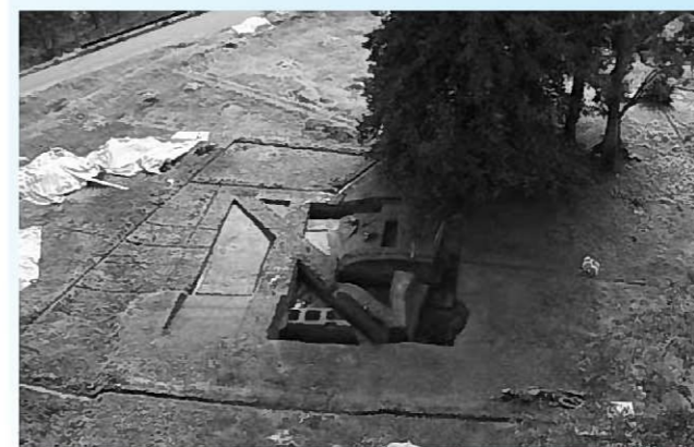
北から見た中島跡(右上)と73次調査区