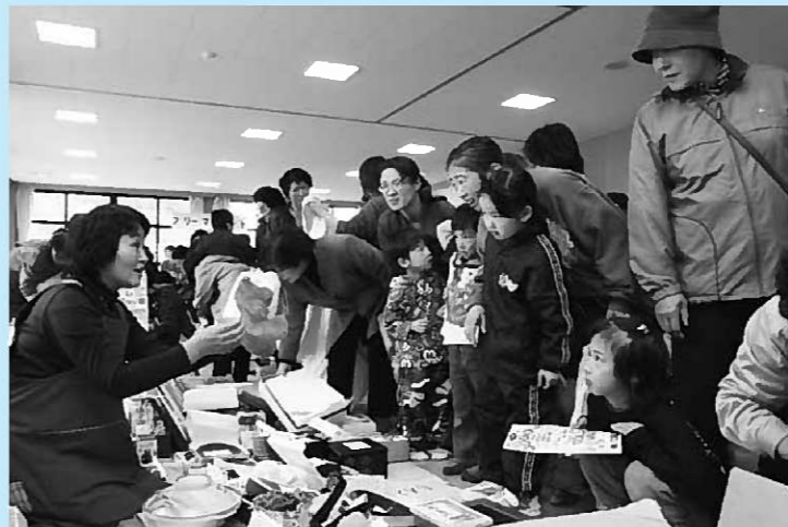
▲売り切れごめんのフリーマーケット