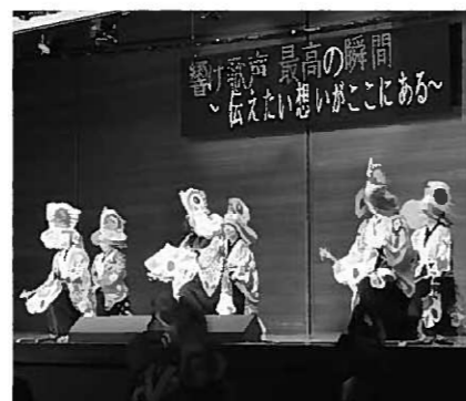
文化祭で神楽を踊る生徒