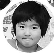
リュウケンドー ふじえ せめて 藤江夢斗