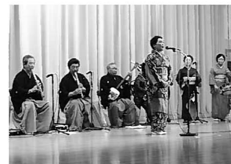
昨年の町芸術文化祭舞台部門発表会