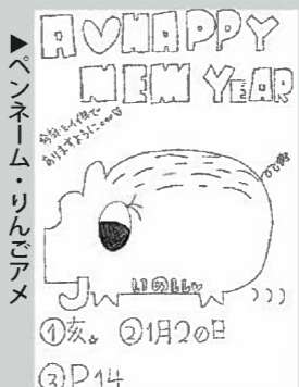
▶ペンネーム・りんごアメ