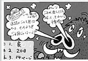
▲ペンネーム・ごみ捨てないの〜しし