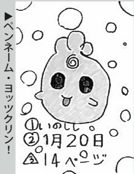
▶ペンネーム・ヨツツクリン!