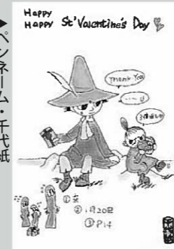
▶ペンネーム・千代紙