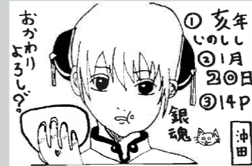
▲ペンネーム・ごみの分別にご協力ください