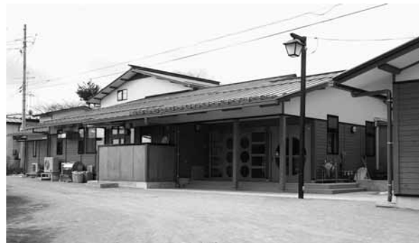
町立幼稚園に隣接して建てられた平泉保育所園舎