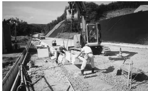
18年度に完成した町道髷石線