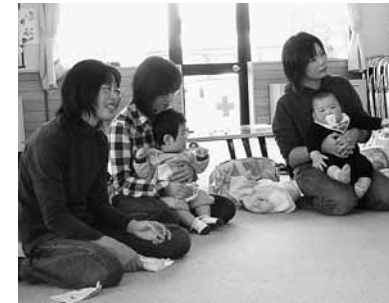
月1回開かれているピヨピヨ広場での親子の触れ合い

2位「バスや電車内で席を譲ってもらえない」 3位「歩きタバコ、たばこの煙/禁煙対策が遅れている」 が挙げられています。 またグラフにあるように、多くの妊産婦さんは妊娠中や、子育て期間中に孤独や負担感を抱えています。