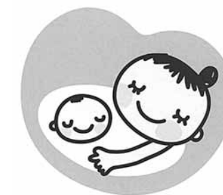
マタニティマーク

身近にいる家族や、周りにいる人たちがいつでも暖かい手を差し伸べる、お母さんと赤ちゃんにやさしいまちづくりが求められています。 町保健センターでは平成19年度から、母子手帳交付時に、マタニティマークのシールをプレゼントします。母子手帳やバッグ、携帯電話に張ったり是非、ご利用ください。 そして、このマークを付けている妊産婦さんを見掛けたら、「電車・バスなどでは、優先して席を譲る」「近くでの喫煙は控える」「お手伝いしましょうか?」のやさしい一言を掛けるなど、皆さんからの思いやりのある気遣いをお願いします。