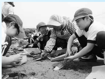
発掘作業を体験する平泉小児童

午前の部では、平泉文化共同研究者4人による研究発表と柳之御所遺跡についての報告があります。午後