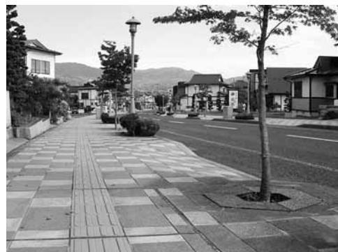
整備された毛越寺通り

平泉町にとって最高の顕彰である世界遺産登録は、来年の7月に予定されています。それまでに多くの意見を出し合って、さらに良い平泉を目指していきましょう。 世界遺産推進室