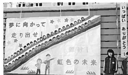
心を込めたメッセージの数々にも感動!

中でも圧巻だったのは4年生の発表でした。来年度の運動会で初めて挑戦する組み体操を表現に取り入れ、高度な技を次々と披露してくれました。これには6年生も拍手喝采でした。マーチングバンドの引き継ぎでも、見事な演奏を披露してくれた4、5年生。最後はくす玉と巨大なメッセ