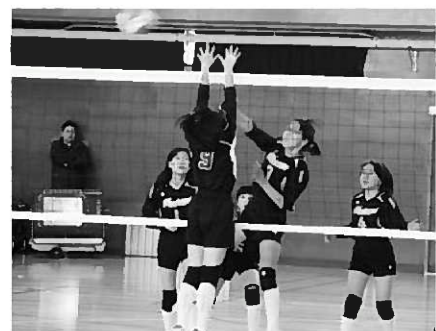
熱戦を繰り広げる選手たち

第21回佐々木製菓杯一関地方小学生バレーボール大会が2月9日、町内小中学校体育館で開催され、当町の平泉バレースポ少が第3位と活躍しました。同チームは予選リーグで蔵美クラブと興田スポ少にそれぞれ2-0で勝利し、1位で予選リーグを通過しました。決勝トーナメントの準々決勝では、マリオンバレースポ少を2-0で下し、準決勝では萩黒澤バレースポ少と対戦。毎セット接戦となりましたが一歩及ばず、惜しくも0-2で敗れましたが、3位入賞を果たしました。また長島バレースポ少チームも、準決勝で敗退したものの、毎試合接戦で練習の成果を発揮していました。