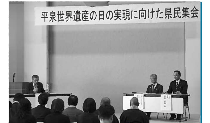
平泉世界遺産の日実現に向け意見が交わされました