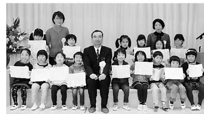
一人ひとりに表彰状と記念品が贈られました(写真上)／表彰を受けた園児(写真左下)と65歳、70歳の皆さん(写真右下)

表彰式では、25年度幼児施設の歯科健診でむし歯が1本もなかった5歳児19人と、成人歯科健診で65歳で自分の歯を25本以上保持している11人、70歳で20本以上保持している24人が表彰されました。