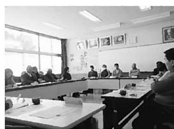
教振協議会の様子

20日には本年度最後の授業参観と懇談会がありました。授業への参観率は87%、なわとび大会で見せた真剣な姿は授業中にもありました。またこの日は、長島小