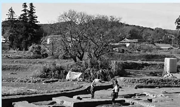
金鷄山方向を向く橋状遺構

周囲には他の橋跡の存在も推測されます。今回の調査成果は、柳之御所遺跡と無量光院跡の関係を裏付け、また金鷄山との遺跡配置の関係も推測される貴重な内容となりました。