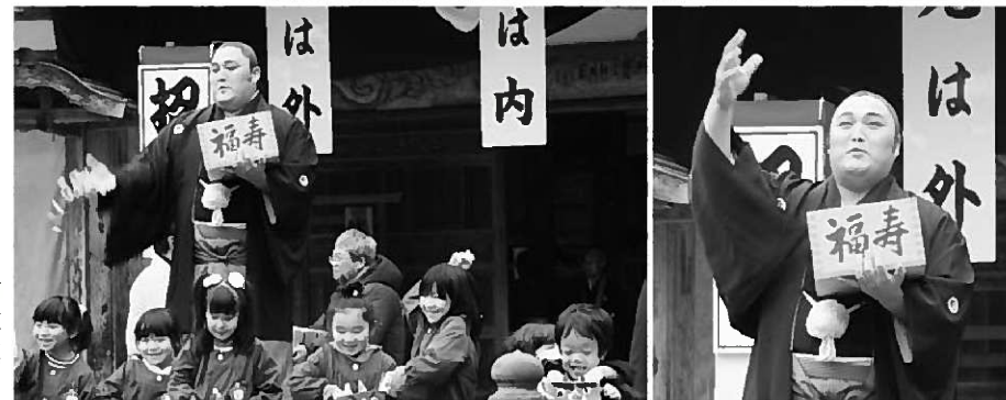
勇ましい掛け声とともに豆をまく参加者(写真上)／笑顔で豆をまく園児(写真左下)／大相撲八角部屋の隠岐の海関(写真右下)