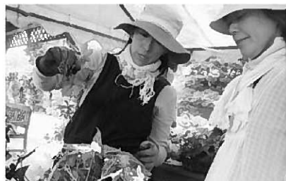
昨年の講習会の様子

【全6回シリーズ】 期 日 …4月下旬~8月下旬 時 間 …その都度案内 場 所 …泉ボタニカルガーデンほか 内 容 …ガーデニングの講習会や見学会 対 象 …一般町民 参加費 …実費徴収