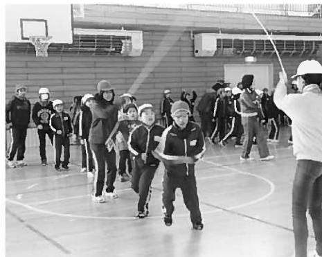
縦割り班で協力し、長なわとびに挑戦

縦割り班で行われるこの大会は、「体力の向上」はもとより「互いに励まし合い協力する態度」の育成をねらいとしています。いよいよ当日です。1年生や2年生の肩に手をあて入るタイミングを教えたり、腰をかかめ跳ぶ人の高さに合わせゆっく