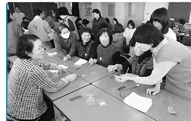
完成したアクセサリーを見せ合う参加者

町内外から参加した約70人は、最初に金色堂と夜光貝の関係について説明を受け、平安時代にはるか南方からもたらされた夜光貝にロマンを感じた様子。そして磨くたびに輝きを増す夜光貝に驚きながらアクセサリーを作り上げ、参加者内で出来栄を比べていました。