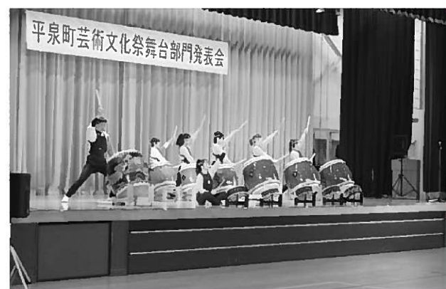
多彩な演目が披露されました(写真は山王太鼓同志会)

会場を訪れた観客らは、ステージ上で繰り広げられる多彩な演目に大きな拍手と声援を送りながら鑑賞していました。