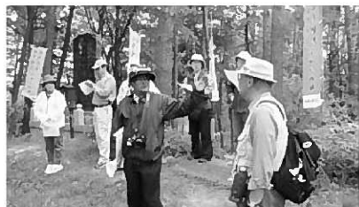
心地よい風を感じながら歴史の勉強ができます♪

【全4回シリーズ】 期 日 …5月下旬~10月下旬 時 間 …その都度案内 場 所 …桜とツツジの道(北上)ほか 講 師 …ボランティアガイド 内 容 …ウォーキング・歴史の学習 対 象 …一般町民 参加費 …実費徴収