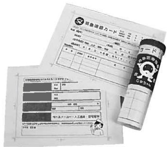
配布する救急医療情報キット