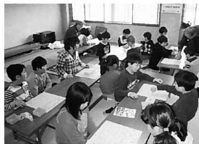
最終日は大会形式で対局します

期 日 …3月24日(月)、25日(火) 27日(木)、28日(金) 時 間 …13:30~15:30 場 所 …町公民館和室 講 師 …日将連平泉支部 内 容 …将棋の基礎 対 象 …町内小学生 参加費 …無料 定 員 …20人 締 切 …3月14日(金)