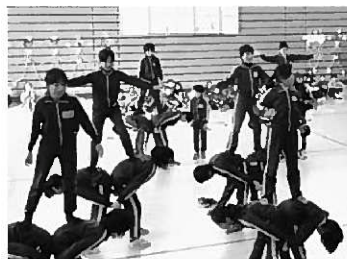
運動会が楽しみになりました

2月18日に6送会が行われました。今年も歌やダンス、卒業認定クイズ? 等々各学年が工夫を凝らし、お世話になった6年生に心を込めたステージ発表をプレゼントしました。