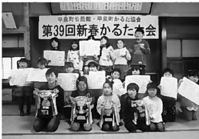
最後まで頑張りました!

第39回新春かるた大会を2月11日、芭蕉館2階大広間(4号線沿い)で開催しました。