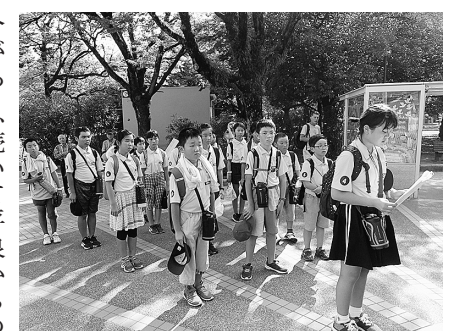
平和記念公園で千羽鶴奉納

令和元年度黄金平泉情報発信プロジェクト「広島県「安芸の宮島」などを訪問し、現地児童と交流」... 7月31日から8月2日までの2泊3日の日程で、町内児童5・6年生15人が参加し、黄金平泉情報発信プロジェクト(町教委主催)を開催しました。