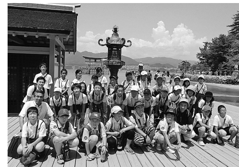
宮島ガイドとの記念写真

令和元年度黄金平泉情報発信プロジェクト「広島県「安芸の宮島」などを訪問し、現地児童と交流」... 7月31日から8月2日までの2泊3日の日程で、町内児童5・6年生15人が参加し、黄金平泉情報発信プロジェクト(町教委主催)を開催しました。