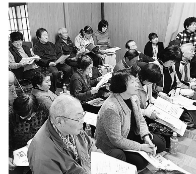
在宅医療に携わる医師との講話

医療と介護の事前講座 医療や介護の現状などを学び、互いに助け合い、支え合う地域づくりを目的とした出前講座を開催しています。昨年度は、俄坂公民館において、17区の皆さんを対象に、在宅医療に携わる医師の講話や13区お茶っこの会と高齢者総合相談