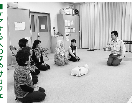
救急救命士による救急講座