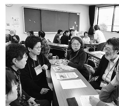
緩和医療に携わる医師などによる講話

在宅介護や医療などに係る基礎知識の普及を図ることを目的とした講座を開催しています。昨年度は、保健センターを会場に、緩和医療に携わる医師や看護師による「がんの痛み」や「緩和ケア」に関する講話、救急救命士による救急講座などを行いました。