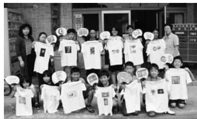
完成したものを持って記念撮影

7月26日～28日に町公民館にて、パソコン基本操作とオリジナルグッズを作成しました。