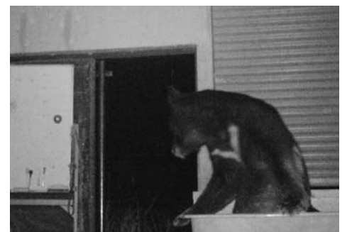
南郷地内に出没したツキノワグマ

カやツキノワグマによる農作物被害が多くありましたが、近年ではイノシシによる被害が深刻化しています。2011年9月に一関市において県内で初めてイノシシが捕獲されると、その後も生息域を北へ北へと広げ、町内では戸河内地域を中心に被害が拡大している状況です。 農地だけでなく市街地でも 農地における農作物被害だけでなく、市街地ではカラスやハクビシンなどによる家屋の汚損被害が発生しています。またニホンジカなどの大型獣が交通量の多い一般道路に飛び出すことで、交通事故を引き起こす原因となる可能性もあります。近年では住宅地付近でのクマ