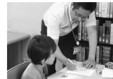
書き方指導を受けている様子

細かな指導のもと、すてきな自由研究が完成しました。テーマごとに準備された図書館の資料などを活用しながら一生懸命取り組み、手際よい作業で、見事に自由研究を完成させました。