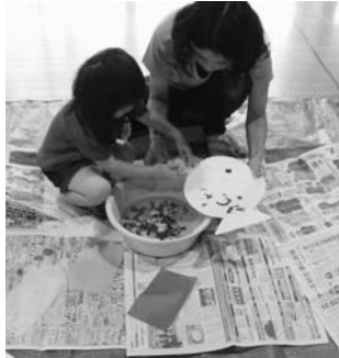
7月 水を使った制作遊び

【のびのびクラブ】 親子のふれ合いを深めると共に、みんなであいさつをしたり、遊んだりする楽しさを感じることができるよう、毎月楽しい行事や活動を企画しています。同年齢の子を持つ親の交流の場ともなっています。