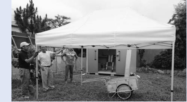
第12区自治会に整備されたテントなど