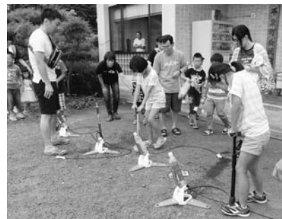
遠くまで飛ぶかな？

8月5日、9組22人の親子がペットボトルロケットを作り、打ち上げました。どのロケットも良く飛んで打ち上げは大成功。水を吹き出しながら勢いよく飛ぶロケットに大歓声が上がりました。