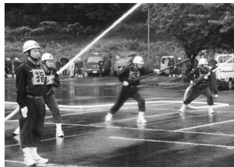
日ごろの訓練の成果を披露