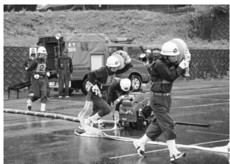
見事な操法技術を繰り広げる消防団員

消防技術の向上と火災防止活動の徹底を目指した町消防操法競技会が7月23日、町営中尊寺第2駐車場で開催されました。本年度の競技会には、町内全9分団の消防団員や関係者ら約100人が出席。降りしきる雨の中、競技ではポンプ車操法の部に3チーム18人、小型ポンプ操法の部には6チーム30人が参加して、日ごろの鍛錬の成果を競い合いました。