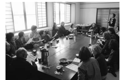
お茶を飲みながら楽しく学べます