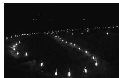
ほたる火のあかりが棚田を優しく包み込む

ました。 【舞川地区でほたる火まつりを開催】 舞川地域課題対策協議会を母体とした若者の団体「舞川イノベーション会議」は8月11日、小塚棚田でほたる火まつりを開催しました。 会場には多くの人々が訪れ、棚田をふちどった優しいほたる火の幻想的な光に見入っていました。