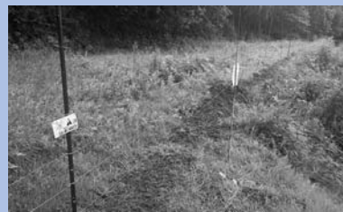
農地に設置した侵入防止柵