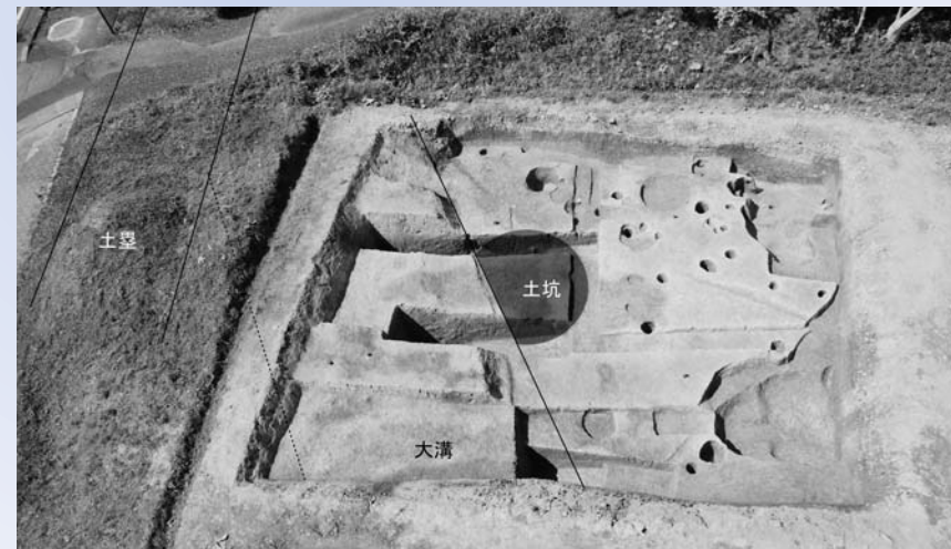
無量光院跡第37次調査区と西側土塁(南から撮影)

今回の調査は、比較的古い時期のかわらげが多く出土しているのが特徴で、無量光院が造営される以前からこの場所が利用されていたことがわかりました。