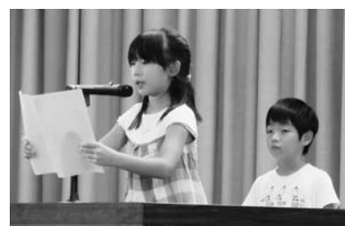
始業式での「2学期の決意」

2学期がスタートし、真つ黒に日焼けした元気いっぱいの子供たちが学校に戻ってきました。5、6年生は、7月25日に行われた町水泳交流会に参加しタイムを競いました。夏休み前には暑い日が多く、約3週間の放課後を主とした練習を通して、それぞれの泳力を伸ばし、当日はほとんどの子どもが自己ベストを出しました。大きな声で頑張る応援を通じての平小交流も有意義なものとなりました。 また、3年生は、7月29日に、町福祉協議会主催