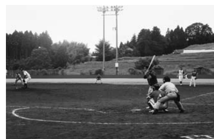
白熱した試合が繰り広げられた

連日熱戦を展開 11区が大会連覇! 町野球協会主催の町内野球大会が8月13日～15日、町営長島球場で、13行政区から約200人が参加しました。 今年で68回を数える同大会は、戦前から毎年恒例で開かれてきた長い歴史を持つ人気が高い大会。決勝戦には昨年と同一カードの11区と12区が対戦。12区が初回に1点を先制。3回表に3点追加点を取るも、3回裏に11区が4点をとり同点。5回表に12区が1点追加し、迎えた7回裏の11区の攻撃。連打でチャンスを生かし2点追加し5-6と11区が逆転サヨナラ勝ちをおさめ、見事優勝を勝ち取りました。