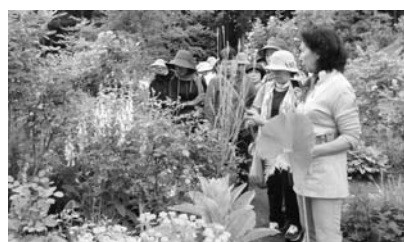
オープンガーデンを見学中

6月11日、奥州市と平泉のオープンガーデンを訪問しました。15人の受講生はそれぞれ工夫された個性あふれる庭を見学し、今後の庭造りの参考にしていました。