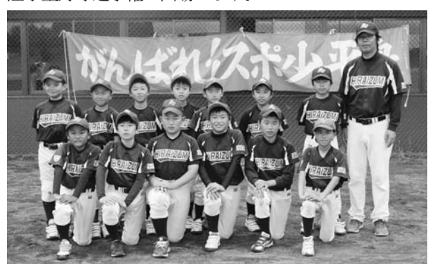
県大会に出場するスポ少平泉クラブのメンバー

同クラブは、7月15日(土)から釜石市で開催される三陸学童野球選手権に出場します。