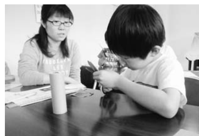
上手に切れるかな?

出来上がった万華鏡をくるくる回しながら「きれい」「面白い」と歓声を上げていました。