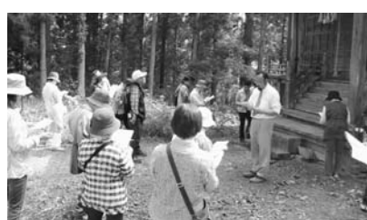
戸河内地区の雷神社にて

6月12日、13人の参加者と骨寺村荘園遺跡へ。西学芸員の説明で、中世から続く農村の原風景を肌で触れました。