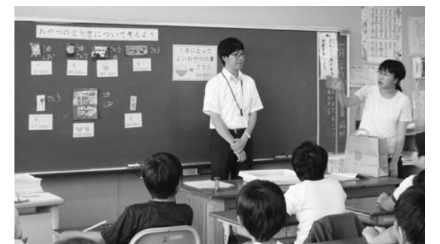
小学4年生を対象とした生活習慣病予防の講話の様子