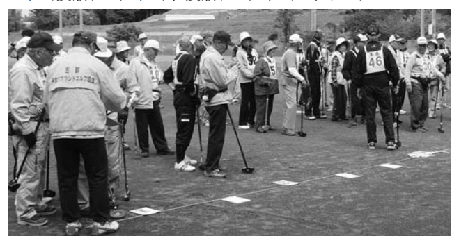
グラウンドゴルフ大会の様子