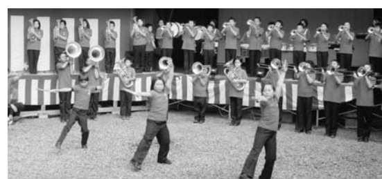
八雲神社の例大祭で演奏をする長島小合奏団

6月13日は本校の自由参観日で、保護者や地域の皆さんに児童の学習や生活の様子を自由に参観していただきました。保護者のアンケートでは、落ちついて学習に向かう児童の姿や、明るくあいさつする姿に感心する声がたくさん寄せられました。この日は長島小学校区教育振興協議会運営委員会も開催され、区長さん、民生児童委員、主任児童委員さんをはじめ運営委員の皆さんにも授業をご覧いただきました。その後の会議では、情報交換を行い、五者(子ども・家庭・学校・地域・行政)が連携して子どもたちの健全育成を図ることを確めました。