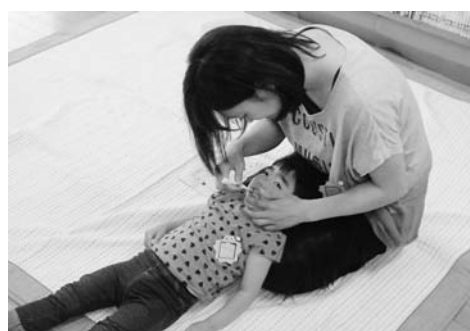
6月みんなの広場「はみがきをしよう」の様子

「ア」と声を出しながら、手のひらを口にあてたり離したりして、音の響きの面白さを楽しみます。