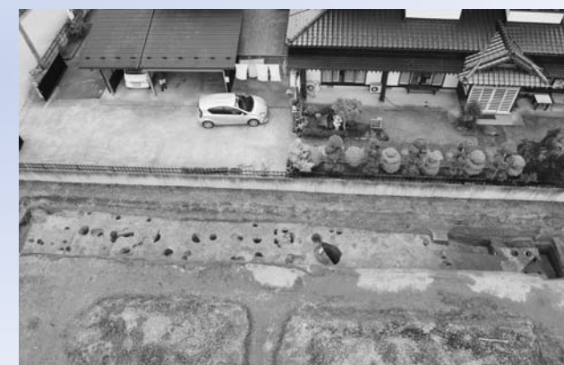
今回の調査で見つかった遺構(南から撮影)

が出土しており、これらの遺物や見つかった建物跡の規模から12世紀の中頃以降に有力者が居住していたことがわかりました。