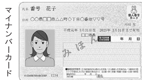
マイナンバーカード

さまざまなメリットがあり、今後ますます便利になる「マイナンバーカード」。ぜひご利用ください！