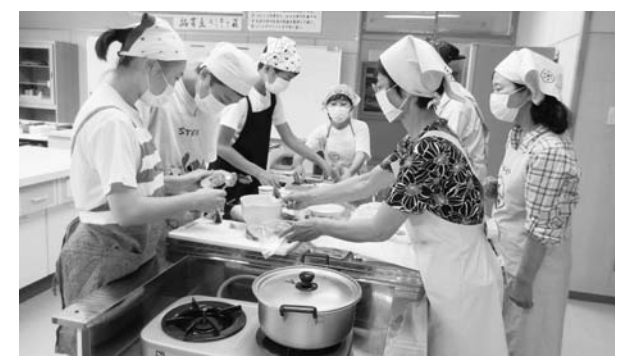
食生活改善推進員が中学生にバランスの良い食事を指導

生涯にわたって、健康で過ごせるよう、子どもの頃から適切な生活習慣が身に付くよう取り組んでいきたいと思います。また、子育てや子どもの発達のこと、食生活のことなどでお悩みのことがありましたら、お気軽にご相談ください。