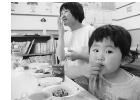
給食試食会の様子