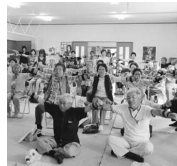
今年の7月から体操を開始した15区の皆さん

膝、腰などの関節に「痛みがある人」「手術したことがある人」は、主治医に体操をしても良いか確認してから、参加するようにしてください。 なお、体操をする場合は、自分の健康状態を把握し、無理のない範囲で行いましょう。