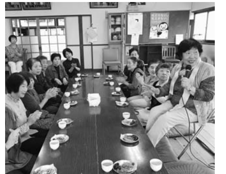
体操の後、カラオケやお茶を楽しむ2区の皆さん