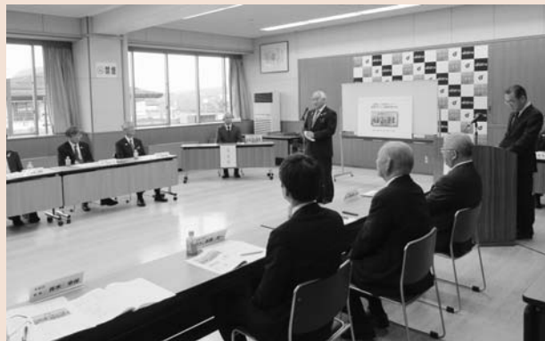
図柄デザイン最優秀作品表彰式の様子