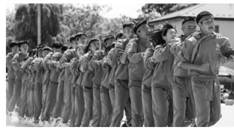
平泉中学校運動会の様子

4月29日に生徒総会が開かれました。今後の活動について執行部から具体的な提案があり、それに対して皆さんの質問や意見が出されました。話し合いの後、承認・決定した事柄について、3年生を中心に意欲的な取り組みが進められています。5月20日の運動会では、全校スローガンを「闘魂乱舞〜歴史に刻め183の鼓動〜」とし、全校一丸となった活動が繰り広げられました。各組リーダーからの一言です。