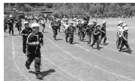
「Let's go タイム」に取り組む子どもたち

5月3日、平泉小学校マーチングバンドが藤原まつりパレードに参加しました。保護者や地域の皆さまはもちろんのこと、観光客の皆さまにも喜んでいただこうと昨年度の2学期から練習を重ねてきた5・6年生は、沿道からの声援を受け、最後まで精いっぱい演奏・演技をすることができました。心を合わせて一つのものを創り上げる喜び、そして、やり抜いた喜びも感じる事ができた子どもたちでした。