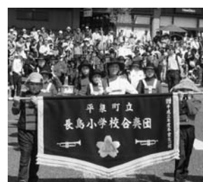
見る人の心に響く演奏をした長島小合奏団

5月16日には、本年度もJ.Aいわて平泉青年部の皆さまに指導をいただきながら、5年生が田植えを行いました。初めて体験した子どもたちは、裸足での作業に戸惑っていましたが、泥の感触を楽しみながら、豊作を願ってしっかりと植えることができました。秋に