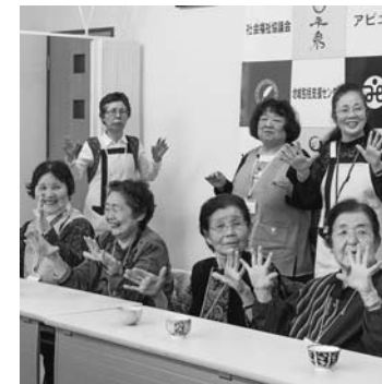
さくらの会の様子

介護予防サポーター養成講座などを修了したボランティアが中心となって、季節の歌やゲーム、体操におしゃべりなど、月1回集まって楽しい時間を過ごします。 《KOVANSA》 介護予防サポーター養成講座などを修了したボランティアが中心となって、季節の歌やゲーム、体操におしゃべりなど、月1回集まって楽しい時間を過ごします。 《平泉いきいき百歳体操》 10段階に調節可能な重りを使ってゆっくり手足を動かす介護予防のための体操を学ぶ講座です。5人以上で実施を希望する地区などには、保健センターで説明に伺います。 ■実施条件 ▽住民主体で、週1回最低3カ月体操を続けること ▽場所、椅子、テレビ、DVDデッキ