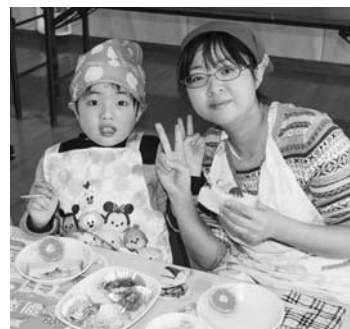
親子でクッキング

■ 小さな変化に気づき認める 食べ物の好みは変化し続けるものです。食べることができた姿を認めながら、今その変化を受け止め見守っていくことが大切です。 6月の予定 ◎園開放日(園庭・園舎) ▽子育て支援センター 毎週月・水・金曜日 ▽長島保育所 毎週水曜日 ◎みんなの広場 歯磨きをしよう 1日(木) ◎のびのびクラブ ピクニックにいこう 21日(水) 6月生まれの誕生会 21日(水) ※参加申込期限 14日(水) ※当日は水筒(水かお茶)、おにぎり、果物、敷物を持参 ◎給食試食会 27日(火) ※参加申込期限 20日(火) ◎問い合わせ先 子育て支援センター (平泉保育所内) ☎46-2767