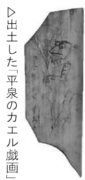
▷出土した「平泉のカエル戯画」