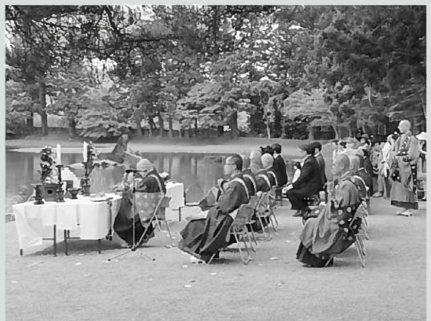
平成27年度「平和の祈り」