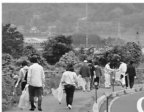
環境整備にご協力ください

■回収 集められたごみは、一般家庭ごみの収集日に合わせて、業者が収集運搬します。その間は集積所にごみが残っている場合がありますのでご了承ください。 ■お願い ▽側溝清掃などによる土や泥については回収できません。 ▽家庭からのごみは、絶対出さないようにしてください。 ■問い合わせ先 世界遺産推進室 ☎46-2218 町民福祉課 ☎46-5556