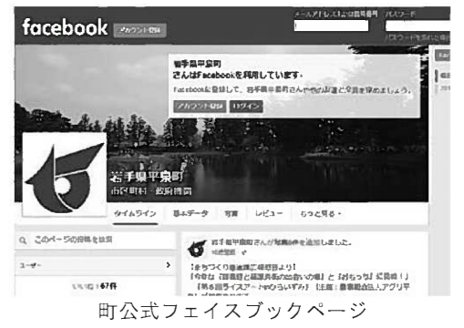
町公式フェイスブックページ

町では、新たな情報伝達手段として、公式Facebook(フェイスブック)ページを開設しました。 町の身近な話題から、イベント・観光・町政情報などさまざまな情報を随時、配信しています。 町民の皆さんも、平泉町に関心を持ち、これから訪れようとしている皆さんも、気軽に「いいね!」を押して、町の情報をご覧ください。 皆さんからのアクセスやコメントをお待ちしています。