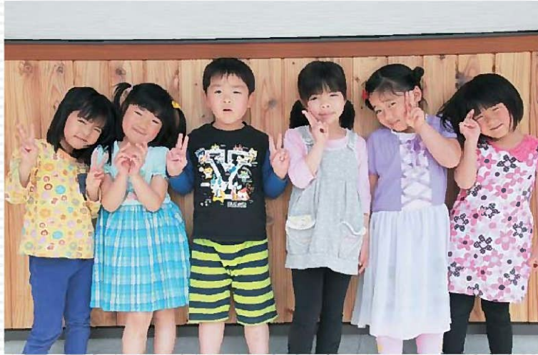
長島保育所へようこそ！