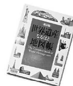
「世界遺産なるほど地図帳」