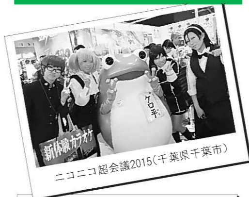
ニコニコ超会議2015(千葉県千葉市)