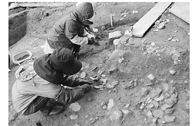
町内で行われている発掘調査の様子