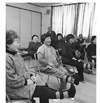
百歳体操に取り組む21区の皆さん

その他 3回以上受講した人には、修了証を交付します。 《平泉いきいき百歳体操》 実施地区を募集しています! 高知市で実施し、介護予防の効果もあげている重りを使った筋力運動です。町では、体操に必要な重りとDVDを貸し出します。5人以上希望者がいる場合は、説明に伺います。