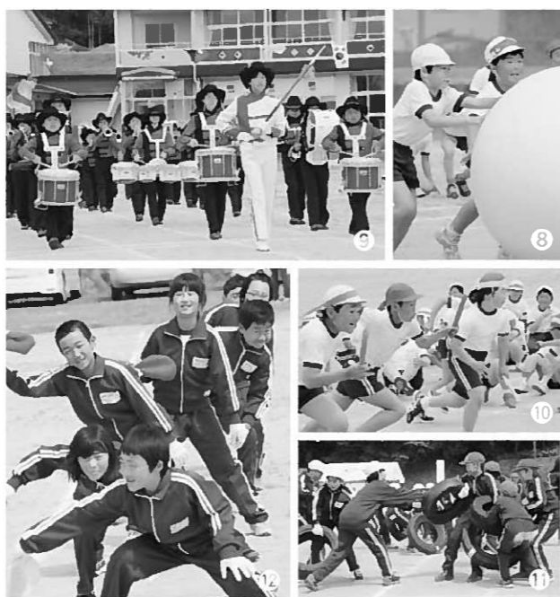
(長島小) ⑧ 低学年による大玉転がし/⑨ ひびけわたしたちの音色/⑩ 高学年の紅白対抗全員リレー/⑪ タイヤを奪い合う高学年/⑫ 赤組のパフォーマンス