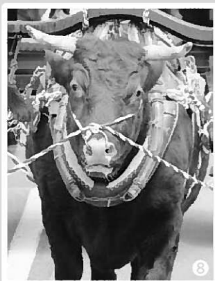
⑥ 華やかな行列が繰り広げられた ⑦ 色鮮やかな着物姿の侍女一行 ⑧ 御所車を引く短角牛の「平」

5月3日に開催された「源義経公東下り行列」では、俳優の高杉真宙さんが義経公役を務めました。時折日が差す暖かい天候の中、色鮮やかな衣装を身にまとった総勢93人の行列が、毛越寺から中尊寺まで練り歩き、華やかな平安絵巻が繰り広げられました。