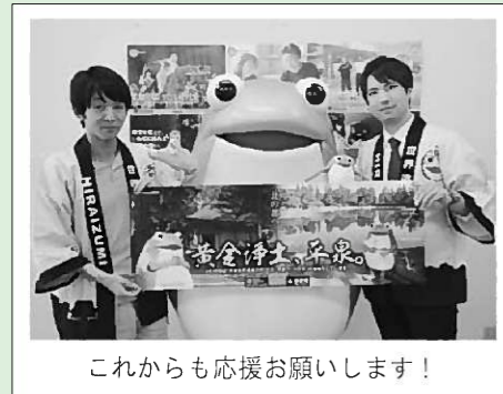
これからも応援をお願いします！

「最後に平泉町の人たちに一言お願いします。」 「いつも応援ありがとうございます。平泉の魅力をPRしていくので、町の人たちにももっと平泉を好きになってもらえたらうれしいケロ！」 フェイスブックでカエルにまつわるスポットも紹介していきたいケロ。カエルの置き物がある場所、カエルのグッズが買えるお店、カエルの群生地などカエル情報を寄せてほしいケロ♡