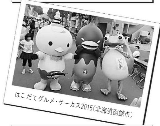
はこだてグルメ・サーカス2015(北海道函館市)