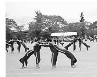
6年生表現「平泉 未来永劫」