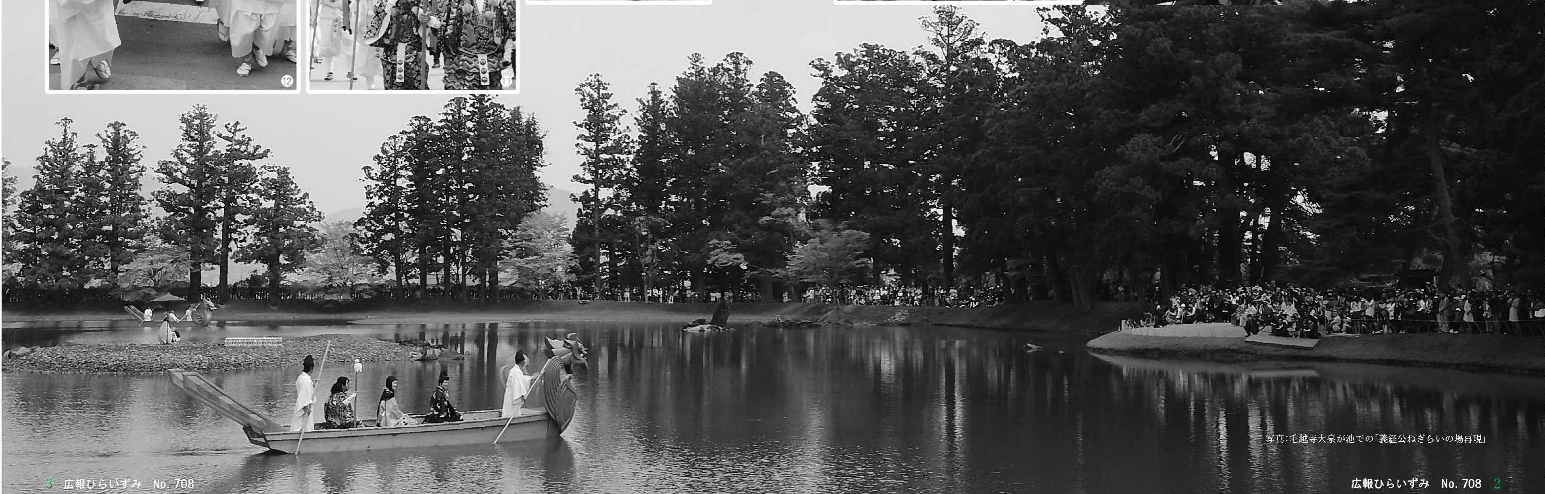
写真:毛越寺大泉が池での「義経公ねぎらいの場再現」