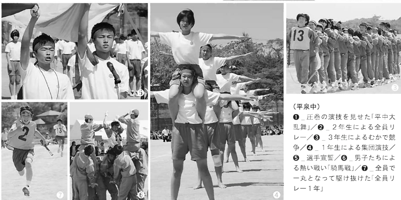
(平泉中) ① 圧巻の演技を見せた「平中大乱舞」/② 2年生による全員リレー/③ 3年生によるむかえ競争/④ 1年生による集団演技/⑤ 選手宣誓/⑥ 男子たちによる熱い戦い「騎馬戦」/⑦ 全員で一丸となって駆け抜けた「全員リレー1年」