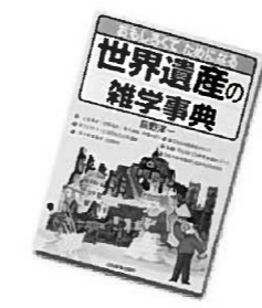
「世界遺産の雑学事典」