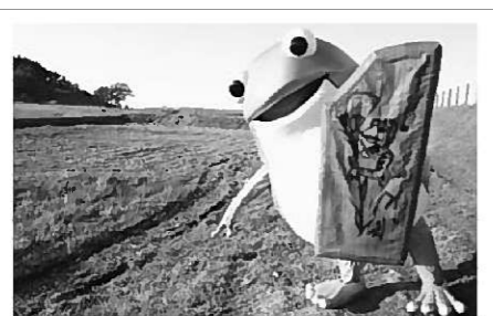
【柳之御所遺跡】ここで発見されたんだケロ平

による「ケロ平」に決定しました。達増知事から、26年6月、ケロ平の着ぐるみのお披露目があり、「世界遺産平泉PRキャラクター」としてのケロ平の活躍が始まりました。