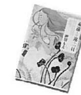
「このあと どうしちゃおう」