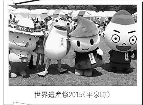
世界遺産祭2015(平泉町)