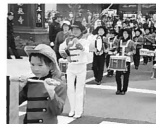
緊張しながらも堂々と演奏した長島小合奏団

去る5月3日、晴天のもと「藤原まつり」が開催されました。今年には世界遺産登録5周年ということもあり、この日は県内外から二十数万人と多くの観光客が訪れました。今年度の長島小学校の合奏団のテーマは、「動き、音、思いを合わせ、心に残る演奏をしよう」で見ると、心に響く演奏をしようと頑張りました。 平泉駅前には、行列と子どもたちの演技を見ようと、保護者や観光客が多数集まりました。その中で緊張しながらも、堂々とマーチングの演奏を繰り広げました。 昨年度から心の準備をしてきたとはいえ、新学期になりわずか1カ月。登校後、リーダーを中心に自主的な練習を繰り返して、フォーメーションを確かなものにしてきました。 より良い演奏を目指して取り組んだ長島小学校合奏団の演奏は、昨年同様、観光客に元気をもたらし希望の音として響いたに違いありません。 また、21日の運動会では、新しいフォーメーションに挑戦し、大きな声援を受けました。