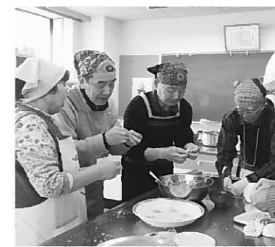
餃子づくりに挑戦中!

「食べる楽しみ」「作る喜び」など、「食」を通じて、生きがい、仲間づくりを目指す男性のための介護予防教室です。 対象者 ：おおむね65歳以上の男性