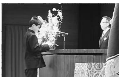
新入生誓いの言葉

介しました。また、1・2年生との交流も行い、安全を守ってくださる方々と親しく触れ合いました。さらに、15日には「少年消防クラブ入団式」が行われ、火事を絶対に出さないとの誓いをたてました。本年度も地域の皆様のご支援とご協力をたくさんいただきながら「平泉の宝」である子どもたちを大切に育ててまいります。