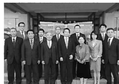
新しい議員の皆さん