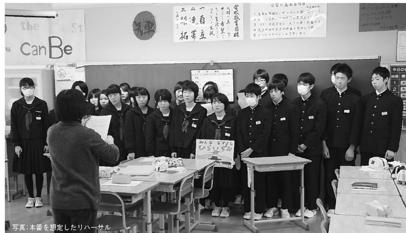
写真：本番を想定したリハーサル

復興支援のための募金活動「折り鶴プロジェクト」を担当。日本語と英語に対応した募金活動をする予定でしたが、28年3月末でプロジェクトの廃止が決定したことに伴い、急きょ合唱隊に編成されることになりました。