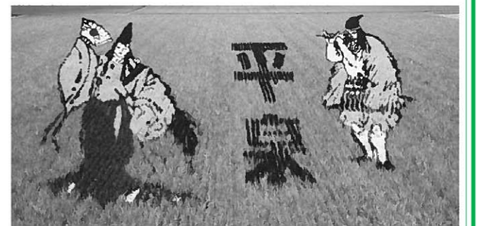
昨年のライスアート。今年も図柄に挑戦します。

(農)アグリ平泉では、今年も「田んぼアート」に取り組みます。8年目となる今回も、田んぼに描いた図柄に参加者の皆さんで田植え体験をしていただき、地域農業と平泉の観光を振興します。 田植え後には参加者による交流もあります。みなさんの参加をお待ちしています。 ■日 時…5月28日(土) 14:00～ ■場 所…長島字矢崎173(高館橋北側ほ場) ■参加費…無料 ■内 容…田んぼアート田植え体験 ■持ち物…長靴、ゴム手袋 ■問い合わせ先…(農)アグリ平泉 ☎48-5858