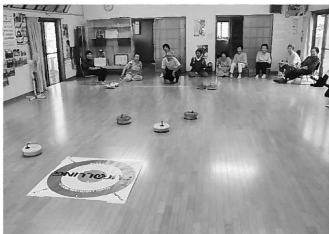
カーリングの面白さを室内で味わえるカローリング

申し込み方法：希望のメニューを選び、開催希望日の3週間前までに教育委員会へお申し込みください。