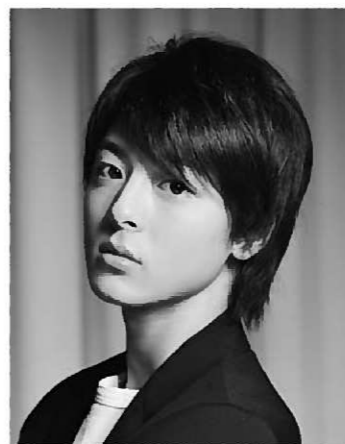
源義経公にふんする俳優 高杉 真宙さん たかすぎ まひろ