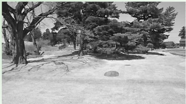
写真 復元された本堂南翼廊基壇(南東から)

— 無量光院跡の整備 — れます。特に今年の中島の周辺の整備により、これまでよりも島の形状が分かりやすく見ていただけたと思います。 この機会に、無量光院跡に足をお運びいただき、復元された中島と併せてぜひご覧ください。