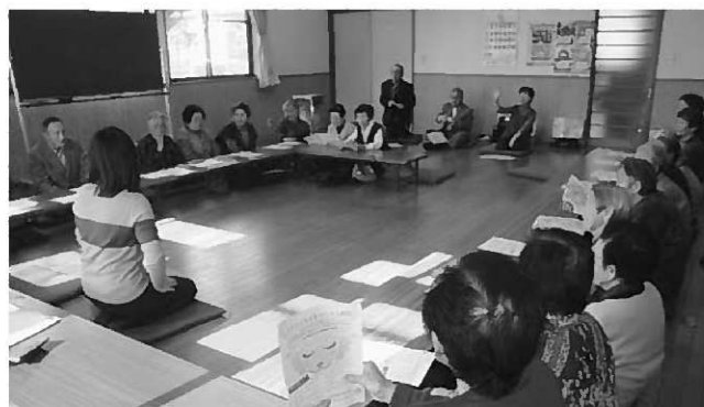
ふれあいサロンの様子