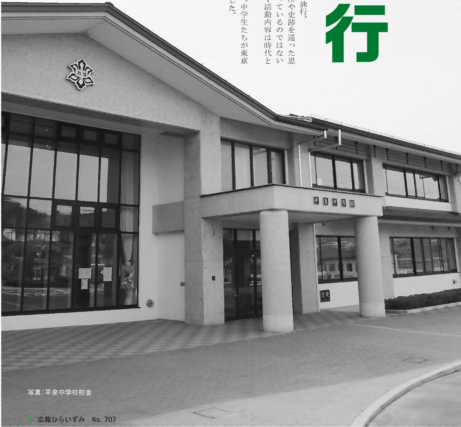
写真：平泉中学校校舎