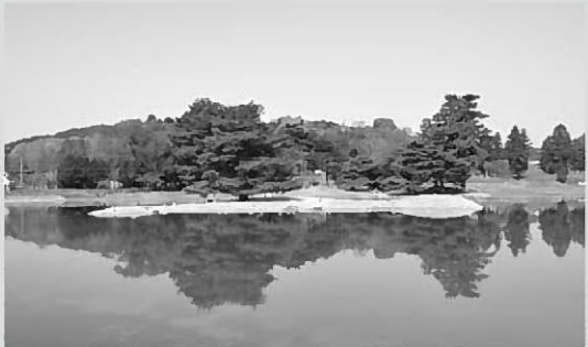
▶ 昨年度の水張りの様子(東から)

平泉の世界遺産を構成する資産の「特別史跡無量光院跡」。町では平成24年度より、当時の面影を再現するため、浄土庭園の復元整備を進めています。本年度は、4月23日から11月13日まで、池に水をたたえた状態で、一般公開します。ぜひ、無量光院跡で極楽往生を体感し、平泉独自の浄土空間を体感してください。