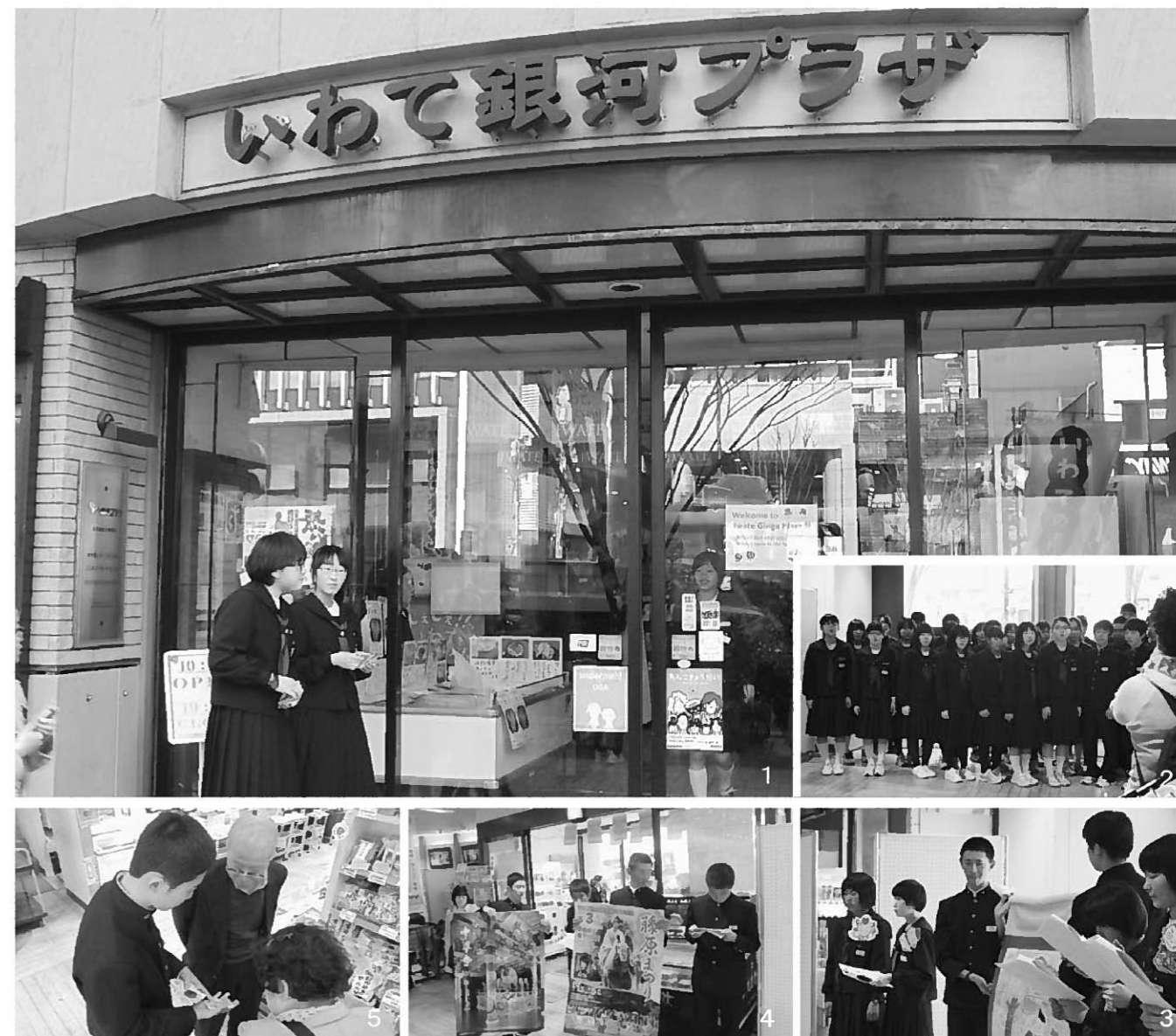
1.平泉PR活動の会場となった「いわて銀河プラザ」/2.合唱隊による「ふるさと」の合唱/3.大型紙芝居での平泉の紹介/4.「春の藤原まつり」など平泉のイベント情報をPR/5.お客さんに手作りの「オリジナルマグネット」を手渡す

「わたしたちは岩手県の平泉中学校の3年生です。今回修学旅行で東京に来た機会を利用して、私たちのふるさと、『平泉』の紹介をさせていただきたいと思っています」 4月12日午後、東京都中央区銀座のいわて銀河プラザに来店されるお客さまに語りかける生徒たち。平泉中学校3年生が、修学旅行の一環で、平泉アピール活動を行いました。 平泉アピール活動では、事前打ち合わせをしていた通り、①平泉の説明担当②合唱担当③紙芝居担当④マグネット配布担当の4つに係を分担しました。まずは平泉の説明担当の司会進行に合わせ、平泉の歴史とともに世界遺産に登録された「中尊寺」「毛越寺」「観自在王院跡」「無量光院跡」「金鶏山」を中心に、平泉の魅力をお客さまに伝えました。一人一人のセリフが長いため、きちんと伝えるか心配されましたが、事前に練習を何度も繰り返した生徒たちは緊張せず堂々と声を張って発表。聞いていた人たちにきちんと伝わるように、抑揚もつけていました。 合唱担当は「ふるさと」「平泉伝説」の2曲を披露。その素晴らしい歌声に多くの人たちが足を止めて聞き入り、中には涙を浮かべる人もいました。 紙芝居担当は、大人や子どもにも伝わるように、気持ちを込めて話しました。 マグネット配布についても好評で、「このマグネットかわいいね」などの声が聞かれました。準備していた150個のマグネットはすぐになくなり、受け取った人たちに喜ばれていました。「今日のわたしたちの発表で、平泉に興味を持っていただけました。幸いです。平泉には四季折々の魅力的な祭りがありますので、時季を合わせておいでください。ぜひ、より楽しい観光になるかと思えます。いつの日か、皆さんが平泉にいらっしやることを心よりお待ちしております」。 こうして生徒たちの1時間にもわたる平泉アピール活動は大成功で幕を閉じました。