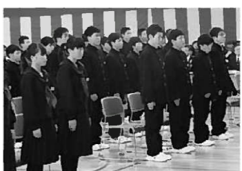
決意を新たにする新入生

きるのが楽しみです。部活動をするのも楽しみです。先輩方に教えていただき、ついていきたいと思いをもちます。中学校の素晴らしい合唱と一緒にできることも楽しみです。仲間とともに行事を通して成長していきたいです。」また、迎える側の生徒「本年度は皆さんとともに、生徒会スローガン『創造』のもと、日々成長し続ける平泉中学校にしていきたいと思いをもちます。平泉中学生徒会の一員であるということを自覚し、伝統を引き継ぎながら、私たちのカラーで新たな文化を創り上げていきたいと思います。」3年生は修学旅行、2年生は宿泊研修、1年生は対面式、応援歌練習を終え、全校生徒175人の本年度の平泉中学校が順調に始まっています。