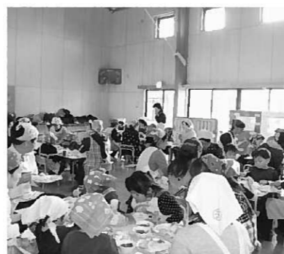
親子クッキングの様子