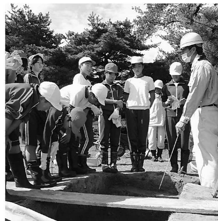
平泉学・発掘体験をする長島小児童