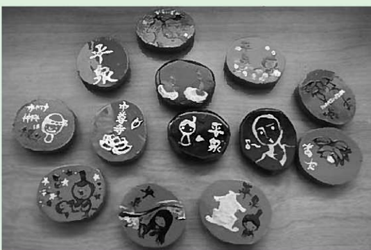
かわいいイラストが描かれた「オリジナルマグネット」

お店に来たお客さまに配布するグッズの制作を担当。グッズは漆仕様のマグネットにし、町で古くから大切にされてきた漆工芸「秀衡塗り」の雰囲気が伝わるようにしました。特徴ある表面の絵は生徒たちのオリジナルです。