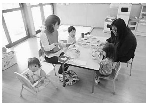
みんなで一緒に食べると美味しいね！

小さなお子さんのいる家庭では、子どもの発達に合わせてメニューを考えていること、思いのまま。給食試食会では、お子さんの年齢でどんな食事をしていいのか、食材の内容や調理法、盛り付ける量などを参考にしたい。だく場となっています。保護者の皆さんもお子さんと一緒に参