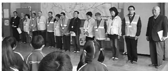
本年度お世話になるスクールガードの皆さん

4月8日には、一斉下校指導を行いました。担当教諭からは下校途中に大地震があった場合の行動の仕方についての話をしました。長島地区は、見通しの悪いカーブや坂道が多く、自転車乗りや歩行には危険がいっぱいです。危険から身を守るために、「自分で考え判断し、命を守る」との大切さを子どもたちに指導しました。その後、各担当の職員と一緒に、高学年を先頭に下校しました。