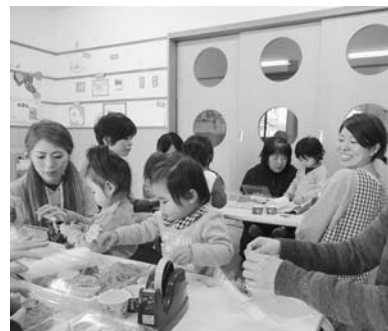
「みんなの広場」の様子

風邪やインフルエンザが流行する時期となりました。風邪やインフルエンザの予防対策として挙げられるのが、野菜や果物からビタミンを摂取し、ウイルスの侵入を防ぐことです。ウイルスは湿度の高い部屋が苦手なため、加湿器などを使い、湿度を一定(60%前後)に保つことが大切です。ただし、1時間に1回は窓を開け換気を心掛けてみましょう。 そして外で遊んだ後や、食事の前には手洗い、うがいを欠かさないようにしましょう。 手洗いや鼻かみといった清潔の習慣は、食事や排せつと違い、「ほしい」という生理的な欲求が低いので、身に付きにくい習慣の一つです。