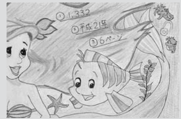
ペンネーム・ハンギョドン