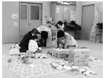
子育てについての相談や情報交換もしています

1月6日の「のびのび広場」は、保健センターを会場に開催し、1歳からの在宅児5組子ども6人の参加がありました。 「体操をしよう」ということで、体を動かして遊びました。「ふためきつね」の歌に合わせて全身運動や、おうちの人の膝に乗せて「しし」と言いながら、おなかをこすったり、だっこしてゆらゆらと体を揺らすお風呂「こ」ポカポカお風呂」をして、ふれあいを楽しみました。 のびのび広場は、自由に遊べる楽しい場所です。また日ごろの子育てについての情報交換、相談なども行っています。 今月は3日(火)に保健センタ