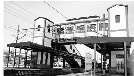
◀整備されたエレベーターと線橋の外観