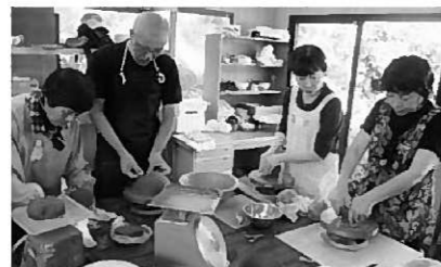
作品作りに没頭中

9月21日(日)、作品の成形を行いました。受講者は、最初何を作ろうか悩んでいたようですが、要領を覚えてからは、次々とオリジナル作品を形にしていました。次回は10月12日(日)に絵付け、釉薬の作業を行います。