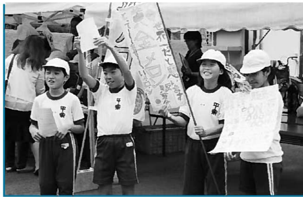
手作りのポスターやのぼりでPR

参加した児童は「お客さんがたくさん来て大変だったけど楽しかった」、「大きな声で宣伝することと会計を素早くすることを心がけた」など感想を話していました。