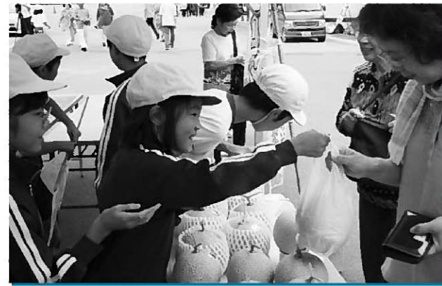
お買い上げありがとうございます

手作りののぼり旗やチラシを作成し、「甘くておいしい黄金メロンはいかがですか」などと観光客らに