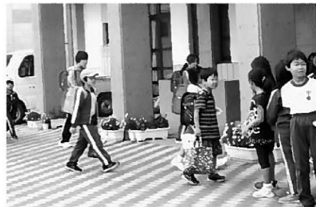
玄関であいさつ運動をする3年生

9月、平泉小学校玄関では、「おはようございます」のあいさつが響き渡っています。児童会執行部の提案により、あいさつ運動を全学年にも行ってもらおうと企画した「平小あいさつ復興プロジェクト」。登校時、各学年が順番に玄関に立ち、登校する友達に元気な声をかけています。これまでは執行部だけで行っていたあいさつ運動でしたが、あいさつする側、される側両方を体験することで、今までよりさらに活発なあいさつができるようになったとの願いのもと、このような活動に広がりました。地域でも子どもたちの元気なあいさつの声が響きますように!