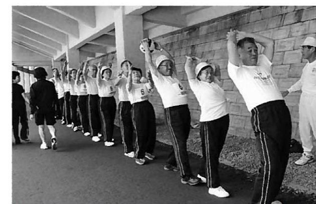
好タイム目指して練習を繰り返す長部チームの皆さん

大会の予選も兼ねている町内シルバースポーツ大会では29連覇中と強さを示している長部チーム。競技では県内各地区の代表がひしめく中、4組で第3位と健闘し、日ごろの練習の成果を発揮しました。