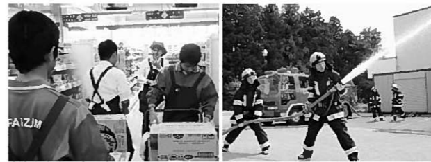
商品の陳列や放水訓練などを体験

9月2〜4日まで職場体験学習が行われました。2年生69名が、平泉町内26カ所、一関市内2カ所、前沢町内2カ所の事業所にお世話になりました。お忙しい中、生徒達を受け入れて働くことの大切さを体験させていただき、感謝の言葉を述べました。