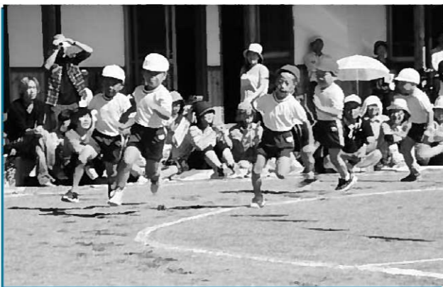
ゴール目指して一生懸命走りました