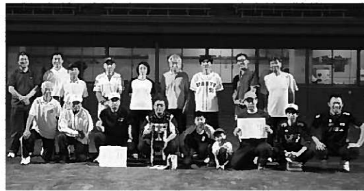
優勝を喜ぶ11区選手の皆さん

町教育委員会が主催する壮年ソフトボール大会が9月9〜12日にかけて、長島球場で開催されました。毎年多くの行政区が参加する同大会は、今年で30回目。今年は19行政区から約330人が参加し、声援や笑いの絶えないにぎやかな大会となりました。 決勝まで勝ち進んだのは、大会連覇を目指す13区と2年ぶりの優勝を目指す11区。 昨年と同カードとなった