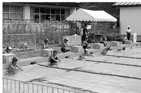
練習の成果を発揮!

9月は子どもたちの力を伸ばす楽しい行事が続きました。1日は校内水泳記録会、12日は祖父母参観日がありました。 水泳記録会は、保護者の皆さまが見守る中、子どもたちは練習の成果を十分に発揮しました。1年生も全員「顔を水につける」ことができました。また、5・6年生は「クロール・平泳ぎ・背泳ぎ(バタフライ)」の2種目で25〜50メートル泳ぐことができるとい学校目標を1