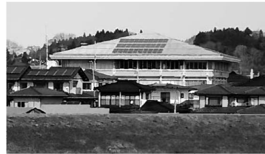
▶再生エネルギー設備導入事業(写真は役場庁舎)