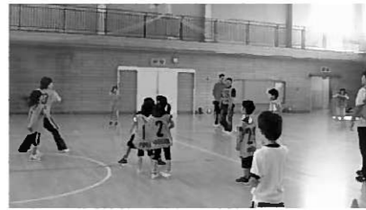
白熱したドッチビーの試合

今回は、ニュースポーツ(ラダーゲッターとドッチビー)を体験。大人と子どもに分かれて対戦したドッチビーでは、3試合を行い、2対1で子どもチームが見事勝利しました。