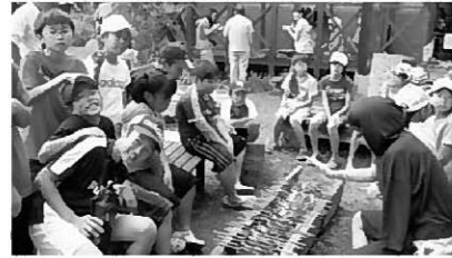
イワナ早く焼けないかな～

9月6日(土)、奥州市衣川区にある「ふるさと自然塾」でイワナのつかみ取りに挑戦してきました。