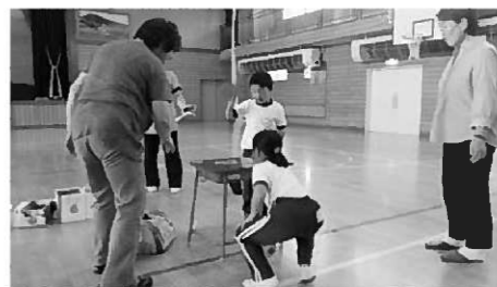
昔遊びを楽しむ1年生

00%達成した実力を見せてくれました。 今年度の祖父母参観は「学校経営説明と合奏団の演奏」からのスタートです。その後、昔遊びをしたり、インタビューに答えていただいたり、俳句を交換したりと、一緒に活動したり教えていただいたりと時間が過ぎました。26日は全校遠足が行われます。大文字キャンプ場まで歩いていきま