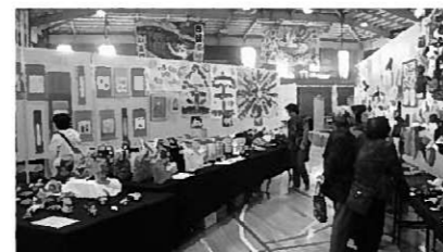
昨年の公民館まつりの様子

本年もさまざまなコーナーを設けて展示しますので、作品の出展並びにご来場のほどよろしく願います。