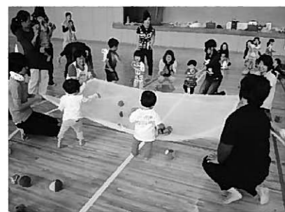
みんなで楽しく玉入れ♪

参加した子どもたちは、頑張ったごほうびに、アンパンマンのメダルをもらい大喜び。競技でもらったおやつをみんなで食べ楽しいひとときを過ごしていました。