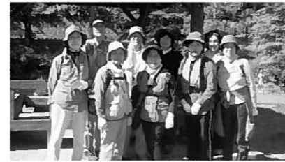
遠野市太郎カッパでの1枚

9月20日(土)に第3回の教室を行いました。今回は遠野市の太郎カッパから福泉寺までの約8kmのコースをたどりました。