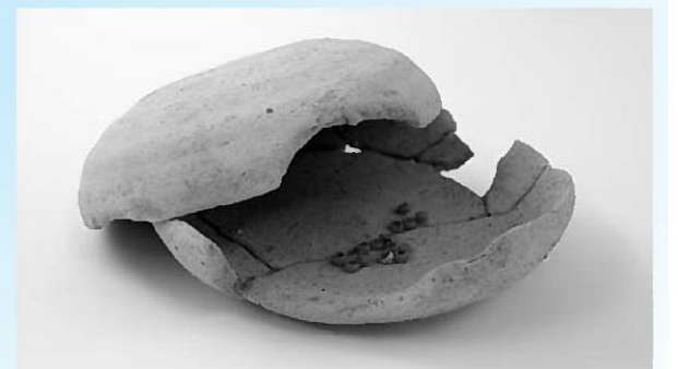
かわらけに収められたガラス玉

瑠璃色と言われる紫がかった奇麗な青色のガラス玉です。井戸の中から1点だけ、他の遺物と混じって見つっています。何に使われたかはわかりませんが、高価なものには変わりなく、調度品や装飾品の一部であったかもしれません。