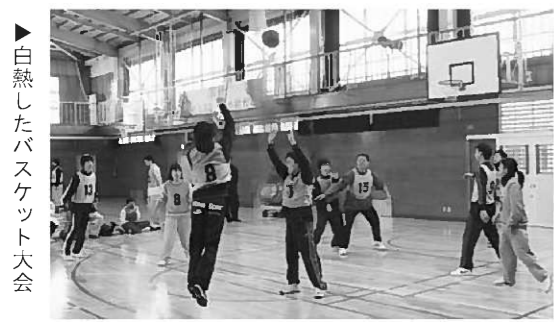
白熱したバスケット大会