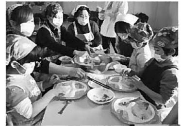
親子で楽しくクッキング(写真左上) / グラデーション寿司も美味い(写真右下)

に挑戦しました。料理することを通して、料理ができるようになったり、食べ物を選ぶ力をつけたりと食の体験を広げ、食べることへの関心が一段と増していくことが期待されます。 エプロン姿の園児は、あらかじめ用意された炒り卵や鶏ひき肉のそぼろ、さやいんげんの千切りなどの具材と酢飯を上手に盛り付け、親子で料理する楽しさを体験していました。