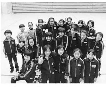
大会に向け練習にはげむ子どもたち