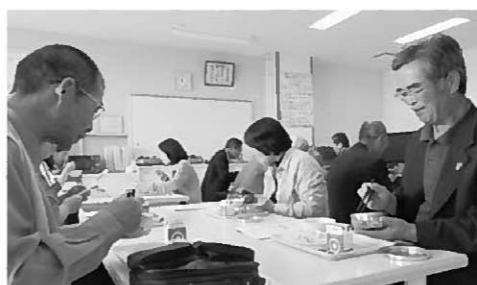
教頭運営委員の皆さんも試食

長島小学校では、安全でおいしい給食を、調理員2人で担当しています。栄養バランスや味付けはもちろんです。出来たての食事が子どもたち