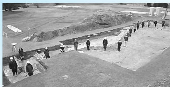
岬と入江(岬の北岸に人が立っています)

無量光院跡がモデルとした平等院の池では、池北側から岬と入江が部分的に見つかり、本堂のある中島と北小島・岬・入江との位置関係が平等院と似ていることが確認されました。このことは平等院との類似性を考える上で重要な成果といえます。