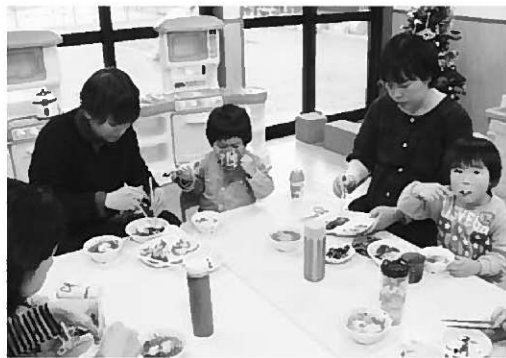
つきたてのお餅をおいしくいただきました

4組の親子の参加があり、もちつきを見学した後、子育て支援センター室で、出来たてのおもちをいただきました。 おもちが部屋に運ばれると「わくわく」と歓声が上がり、あんこもち、納豆もち、雑煮もちを、お家の方に食べやすい大きさに切ってもらって食べました。 今月の給食試食会は、28日(火)に予定しています。 ぜひ、ご参加ください。