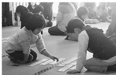
昨年度の大会の様子