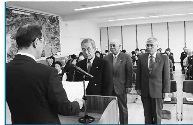
交通安全コンクールの表彰を受ける各行政区長

【交通安全コンクール前期の部】▷1位=2区▷2位=15区▷3位=9区【同後期の部】▷1位=19区▷2位=1区▷3位=15区