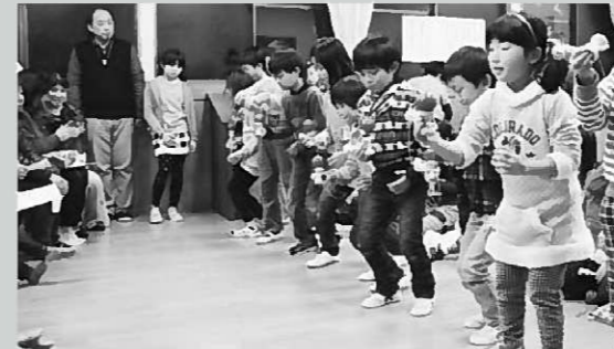
音楽に合わせてけん玉をする児童

放課後児童クラブ「すぎのこクラブ」のクリスマス会が12月24日、同施設のホールで開かれました。会では、音楽に合わせてリズムカルにけん玉をしたり、歌やダンスで大盛り上がり。にぎやかな声がホールいっぱいに響いていました。