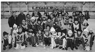
スケートリンクで集合写真♪

25年度のわんぱく塾は今回で最終回でした。来年度も貴重な体験ができる内容を実施しますので、わんぱくなみんなの参加をお待ちしています。