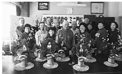
皆さんとても上手にできました!