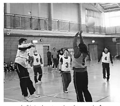
白熱したソフトバレー大会