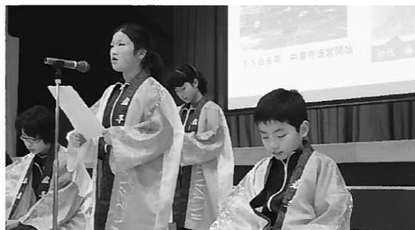
宣伝効果満点の「はっぴ」を着ての発表でした

15分程度の発表でしたが、内容の充実ぶりもさることながら、平泉の素晴らしさを全国に広げようとする意気込みに満ちたとても堂々とした発表態度で、聞いていた児童たちも皆最後まで真剣に聞き入っていました。