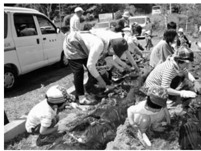
昨年ののびのびクラブの様子(サツマイモの苗植え)

4月の予定 ◎園開放日(園庭・園舎) ▽子育て支援センター 毎週月～金曜日 ※10日(木)は入園式の為なし ▽長島保育所 毎週水曜日 ◎のびのび広場 8日(火) ◎おひさま教室③ 9日(水) ◎なかよしサロン 11日(金) ◎おひさま教室① 11日(金) ◎のびのびクラブ 15日(火) ◎のびのび広場 16日(水) ◎ピヨピヨ広場 17日(木) ◎おひさま教室② 17日(木) ◎おひさま教室③ 22日(火) ◎おひさま教室① 23日(水) ◎給食試食会 25日(金) ◎おひさま教室② 30日(水)