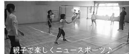
親子で楽しくニュースポーツ♪

ビーチボールという競技は、ボールが予測不能な動きをするので、思うようなところに飛ばすことが難しく、試合展開も早いので、意外と奥が深いスポーツでした。