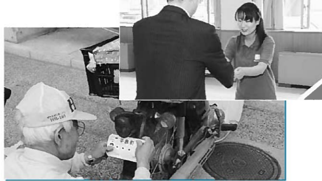
真新しいナンバーを早速取り付ける(下)