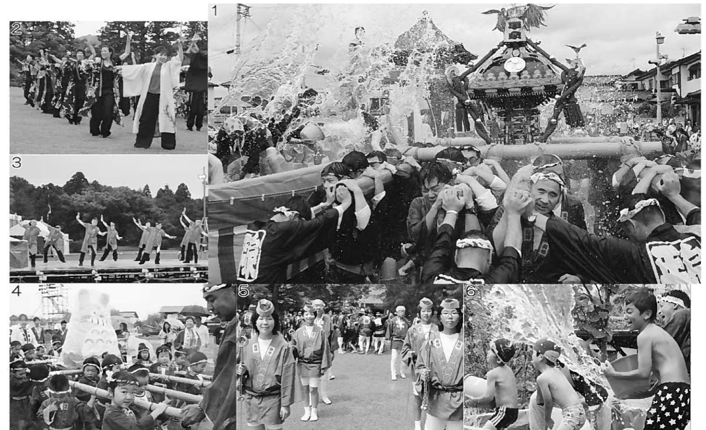
1. 駅前では大量の清め水が浴びせられました/2. 雨の中、迫力あるステージを見せるよさこいの演舞/3. 玄米ニギニギ体操で健康増進をPR/4. 幼児神輿も元気に担ぎました/5. リリしい姿の金棒隊/6. トラックの荷台から清め水を浴びせる子どもたち

▶ 測定件数が複数で国が示す基準値(一般食品1kg当たり100ベクレル)を下回った品目は、最低値と最高値を表示しています。