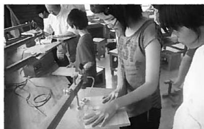
ちゃんとできるかな?

7月6日、町公民館主催「第3回わんぱく塾」が開催されました。今回は、西行桜の森～木工芸館「遊鶴」～で木工工作を体験してきました。