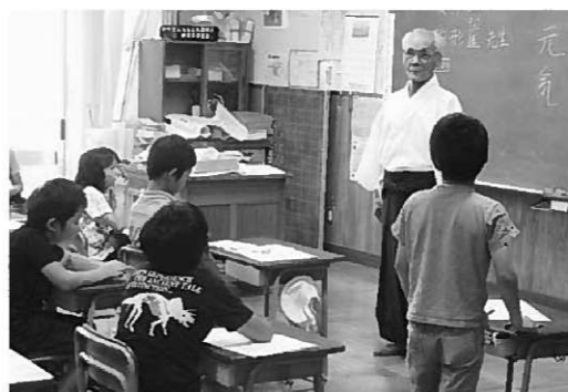
駒形宮司から八雲神社について教わる3年生

2年生は、学区の通学路を中心に探検。農作業をしている人にも「こんにちは」と元気なあいさつができました。さらに範囲を広げ、1年生と一緒に毛越寺・観自在王院跡も訪問しました。 3年生では、スクールバスによる長島探検。いずれ