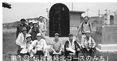
第1回「伝説義経北コースのみち」