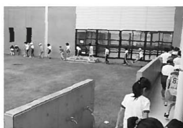
アリの行列を観察する子どもたち

地面を見ながら、3年生がまるでアリさんのように行列を作っています。そう、実は突如アリの行列が学校の中庭に出現したのです。子どもたちは、初めて見る光景に皆びっくりしていました。その大群はいったいどこからやってきたのかは不明でしたが、こつぜんとして消えているところを見ると、アリは巨大な巣を校舎の地下に作っているのかもしれない。まさに自然の驚異を垣間見る思いがした出来事でした。