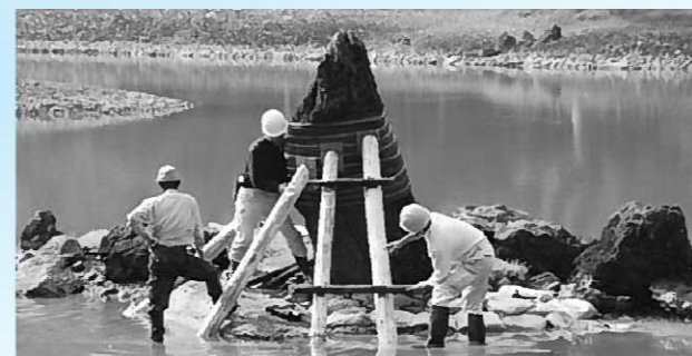
立石の転倒を防ぐために取り付けられた支柱