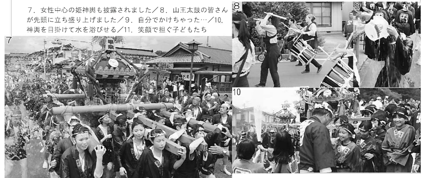
7. 女性中心の姫神輿も披露されました/8. 山王太鼓の皆さんが先頭に立ち盛り上げました/9. 自分でかけちゃった…/10. 神輿を目掛けて水を浴びせる/11. 笑顔で担ぐ子どもたち

今年で18回目を数える平泉水かけ神輿渡御(平泉総社神輿会主催)が7月14日に開催され、総勢300人の担ぎ手たちが町内を練り歩きました。 午前10時、観自在王院跡を出发した小学生神輿、中学生神輿、本神輿の3基の神輿は、毛越寺、平泉駅前を経由し、中尊寺金色堂までの道のりを元気に練り歩きました。 町民や観光客がバケツに入れた清め水を神輿目掛けて浴びせ、担ぎ手たちは「わっしょい!」と威勢のいい掛け声を上げ、神輿を担いでいました。 また前日の13日には、観自在王院跡で「宵宮」や「ひらいずみ夜祭り」「商工会夜市」が行われました。あいにくの雨模様の中、町内のよさこいグループなどが華麗な演舞を披露していました。