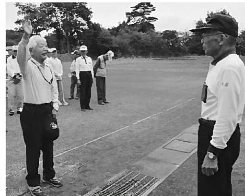
優勝を目指し選手宣誓する4区選手代表

第65回岩手県民体育大会(岩手県等主催)が県内各所で開催され、バスケットボール競技で当町チームが第3位の好成績を収めました。 バスケットボール競技は7月6・7日の2日間、八幡平市の総合運動公園体育館などで行われました。2回戦から登場した当町チームは、30点の大差で金ヶ崎町に勝利。準決勝は前年優勝の紫波町と対戦。リードを許した後半第4クォーターに猛追したものの、あと一歩及ばず惜しくも敗れましたが、2年連続の3位入賞を果たしました。