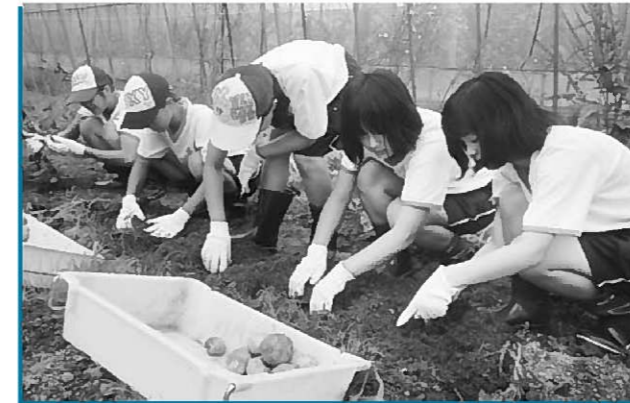
宿泊先で農作業を行う深川第六中学の生徒

同校が当町を訪れたのは、昨年に続き2回目。受け入れ農家18戸の皆さんが出迎えました。生徒たちは、農業体験や民泊などを通じ町民との交流を深めていました。