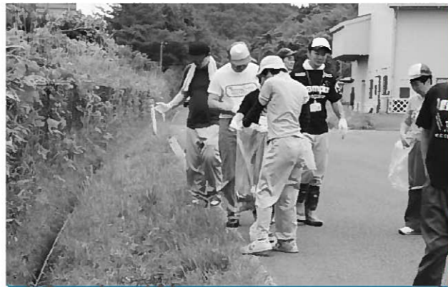
ごみ拾いをする施設利用者とスタッフの皆さん