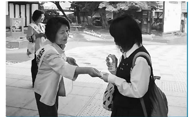
駅前呼び掛けをする推進委員