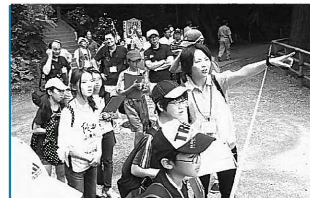
町内の史跡を巡る参加者

この講座は、県南管内の小学校5・6年生と中学生を対象に、12月まで全6回の予定で行われます。