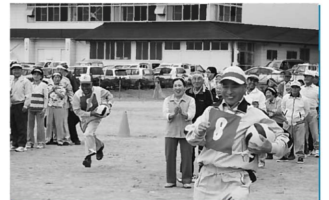
元気いっぱい競技する参加者(写真はボール送り競技)

委員が、ポケットティッシュなどの啓発品を配りながら「おはようございます」と駅利用者や児童に呼び掛けると、「おはようございます」と元気なあいさつが交わされていました。