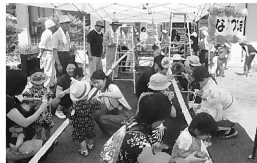
みんなで流しそうめんを満喫。

7月16日の「のびのびクラブ」は、25組子ども37人、大人26人の参加の下、町公民館で「夏祭りごっこ」を開催しました。 この日は、町保健センター主催「男の介護予防教室」の皆さんと、世代間交流として「流しそうめん」を一緒に行いました。 「男の介護予防教室」の皆さんが、そうめんを流す竹のレーンを作っている間、のびのびクラブの子どもたちはアンパンマンのお面を作ったり、ヨーヨーすくいやかき氷を食べて夏祭り気分を楽しみました。 流しそうめん体験では、予防教室の受講者の方に、麺のすくい方を教えてもらったり、「来た来た〜」と声を掛けてもらったりと、和やかな雰囲気の下、たくさん食べていました。