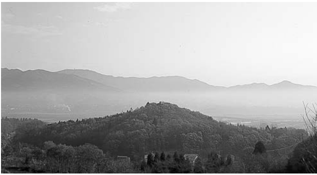
奥州藤原三代が築いた都の中心を表す象徴的な存在「金鶏山」

11月15日、文部科学大臣の諮問機関である文化審議会文化財分科会は、「おくのほそ道の風景地」として、当町の「金鶏山」と「高館」を名勝に指定するよう答申しました。