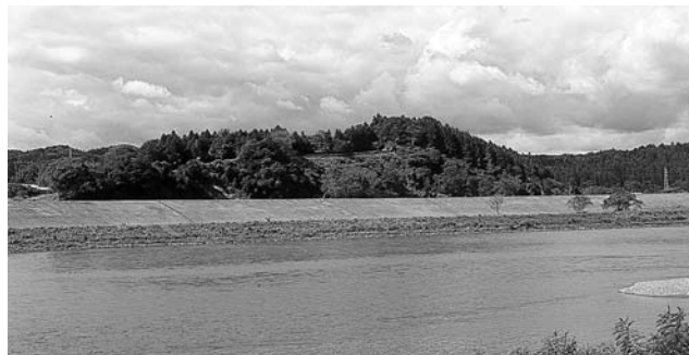
源義経の最期の地と伝えられる「高館」