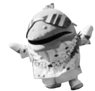
小笠原の世界自然遺産をPRに「おがじろう」も来町