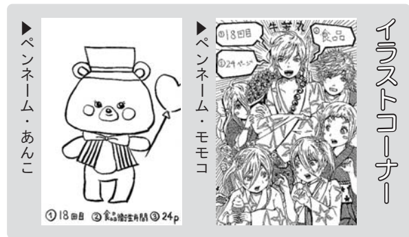
▶ペンネーム・あんこ