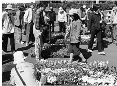
花きセンターでの様子

6回シリーズで開催しているガーデニング教室。第1回目は4月28日(土)岩手県立花きセンターで、洋蘭栽培講習会と花きセンターまつりに参加しました。第2回目となった5月20日(土)には、奥州市のオープンガーデン見学と寄せ植え講習会を行いました。