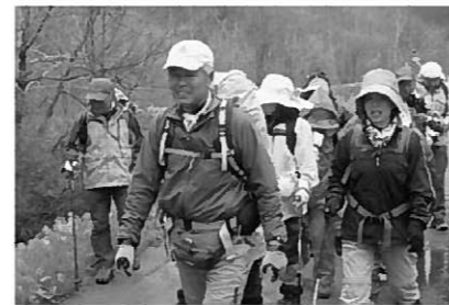
軽快に登っています