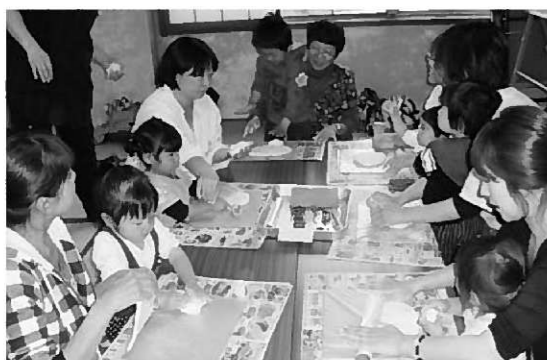
▶壁飾りを作る参加者