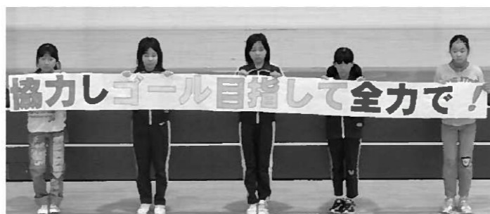
全校で取り組んだ運動会のテーマ

しかし、そんな逆境をも跳ね返す子どもたちのパワーに後押しされながら、与えられた条件の中でより安全で安心な方法を模索し、運動会の開催