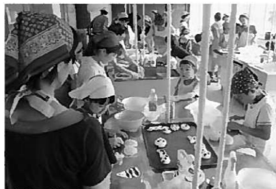
親子ふれあい教室の様子