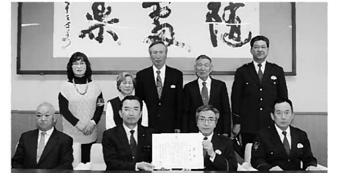
記録継続に向け決意を新たに

町長をはじめ、伝達式に同席した関係者は、この日を新たなスタートとして、安全安心なまちづくりに取り組んでいくことを決意していました。