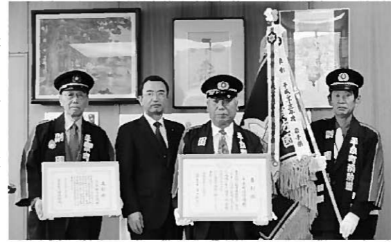
受章を菅原町長に報告する 町消防団幹部