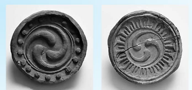
柳之御所跡から出土した軒丸瓦 (写真左/連珠三巴文 写真右/剣頭三巴文)

平泉郵便局と観自在王院跡の間で発見された「鈴沢瓦窯」は奥州藤原氏時代の窯跡で、特別史跡の飛び地に指定されています。ここからは陽刻剣頭文の軒丸瓦が出土しています。