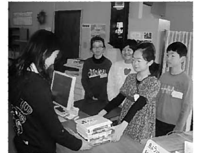
図書館体験の様子

子どもたちは体験を通して、図書館は絵本や小説、専門書のほかに雑誌やビデオ、DVDなどの貸し出しが出来るなど、新しい発見に関心しきりだったようです。