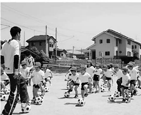
▶ボールを止めるときはコーチの笛に合わせてリズムよく

5月14日には、スポーツ推進委員らをコーチに、園庭で教室が開催されました。会場には、園児たちの笑顔あふれる元気いっぱい