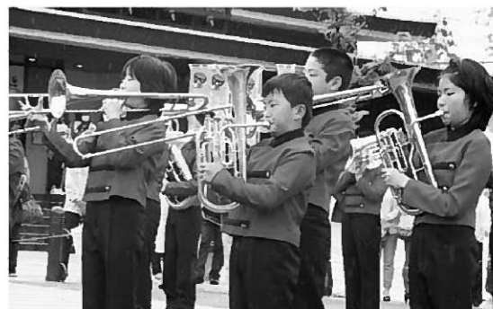
駅前で繰り広げられたマーチング

去る5月3日(木)「藤原まつり」が開催されました。当日はあいにくの荒天。前日からの雨のため、中尊寺からの「出迎え行例」は中止となりました。それでも、町観光協会の計らいにより「駅前でのパレード」を披露することができました。昨年度行われなかったためか、世界遺産登録の影響もあり、日本中・世界中から観光客が訪れました。