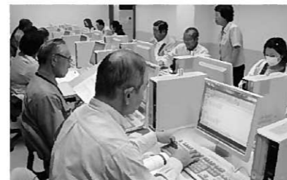
エクセル教室の様子