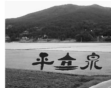
高館橋東側のほ場にくっきりと浮かび上がる「平泉」の文字とロゴマーク

今回、(農)アグリ平泉では、文字部分の「稲刈り体験」を開催します。紫色の古代米を、田んぼに入って刈り取ってみませんか。おにぎり・いものこ汁の振る舞い、お米の分量りプレゼントもあります。皆さんの参加をお待ちしています。 日時…10月24日(土) 9:30~ 場所…長島字矢崎174番地 参加費…無料 持ち物…手袋、長靴、稲刈り鎌 問い合わせ先…(農)アグリ平泉 ☎46-5231