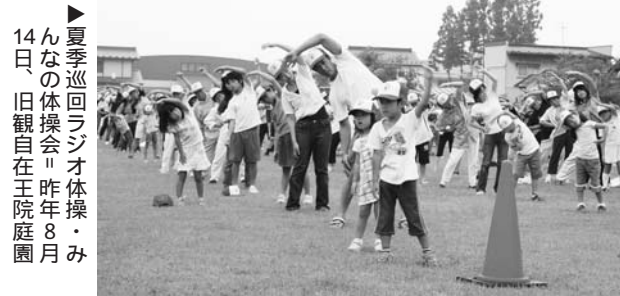
▶夏の巡回ラジオ体操会 14日、旧観自在王院庭園