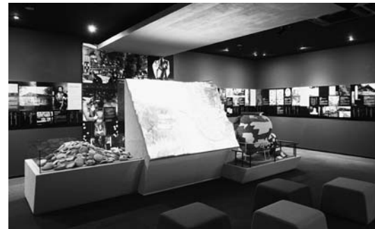
▶平泉郷土館を改修し4月14日にオープンした平泉文化遺産センターの展示室