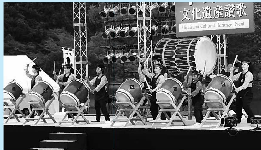
山王太鼓の勇ましい太鼓演奏=2日目