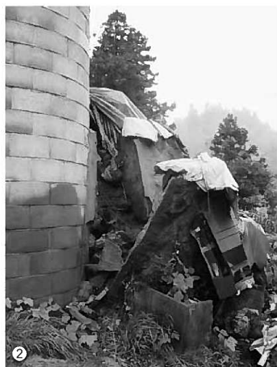
①高速道ボックス内の照明用引き込み電柱が倒れた②畜舎に隣接する壁が、岩手・宮城内陸地震に加えた被害を受け倒壊した。

月14日に発生した岩手・宮城内陸地震に引き続き、当町で震度5強の強い揺れを記録しました。町内では地震の影響により、住宅2棟で屋根瓦が落ちるなどの被害があったほか、住宅以外でも作業場の屋根瓦が落ちるなど2棟が被害を受けました。学校教育施設では、中学校の体育館の壁や渡り廊下の天井の一部はがれるなどの被害がありました。中尊寺、毛越寺をはじめとする文化財への被害はありませんでした。