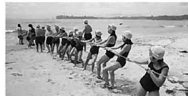
魚をいっぱい引っかきとったぞ～！

平泉小と長島小の児童45人をはじめ、ボランティアや若者倶楽部員など合わせて63人が参加。掛け声を合わせながら協力して網を引き、アイナメやタナゴ、カニなどをどっさり捕獲してきました。