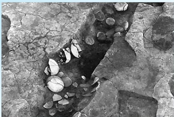
溝跡に捨てられた土器(かわらけ)