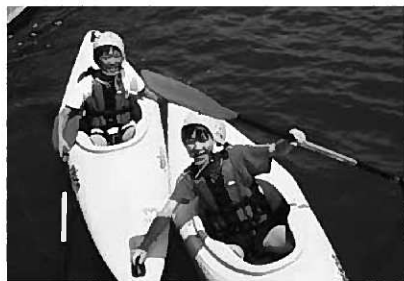
じょうずにこげたカヤック

豊かな体験活動実施 3泊4日の宿泊学習 5年生20人が、高田松原野外活動センターで集団宿泊体験学習を実施しました。これは、昨年度、文科省より「豊かな体験活動推進事業・長期宿泊体験の実施」の調査研究校の指定を受け、2年目の活動として実施したものです。 1日目は、ウォークラリーや和紙工芸、星の観察など余裕のある活動。2日目は、最も人気のあるカヤックをたっぷり3時間。さらに、グラウンドゴルフを楽しんだ後に野外炊事で夕食のカレーライス作り。その夜キンボールも体験。そろそろ疲れも出始めたころ。3日目は自分たちで組み立ててのいかだ遊びにサンドクランプ。夜にはキャンプファイアー。4日目の朝は熟睡状態。広田湾のかき養殖棚の見学が最終活動。 4日間の活動を通して他校生も宿泊する公共の場での過ごし方や自主的に動くこと、協力することの大切さなどをしっかり学んできました。