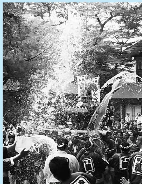
▲容赦なく浴びせられた「清め水」＝中尊寺金色堂前