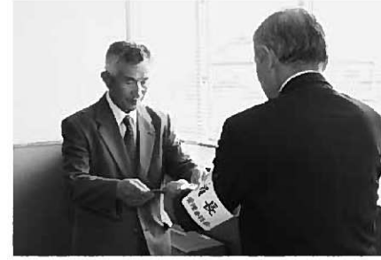
7月7日に行われた当選証書付与式