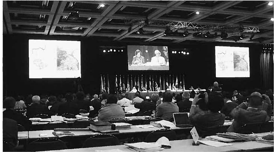
「平泉の文化遺産」の登録の可否が審議された第32回ユネスコ世界遺産委員会

発言した各国の「平泉」についての意見は、「さまざまな要素が絡み合った興味深い資産である」「文化的景観の要素を有している」「精神的な価値を持つ資産である」「仏教の発展を理解する上で重要な資産である」「世界遺産に登録するだけの価値がある」「平泉の価値は疑いない」など資産を高く評価するものも多く見られましたが、その一方で「推薦書が資産価値の証明をうまくできていない」「日本とイコモスの間に文化的景観などについて意見の相違がみられる」など推薦書の内容やイコモス側の意見の食い違いを問題とする発言もありました。イコモスは、「登録における作業指針」を尊重しながら「文化的景観」の概念を説明した後、推薦書の内容がイコモス側の認識と相違がある点を指摘しました。 これらの意見を踏まえて、推薦書の重要な部分の修正が必要であり、比較研究等における協力体制などを盛り込みながら決議文を修正する方向で、議論が