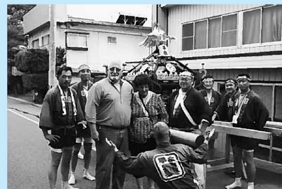
▲休憩時に外国人観光客とバチリ

水かけ神輿の感想は「楽しい！」の一言です。来年も友達と一緒に参加して、今度は絶対に神輿を担ぎたいです！