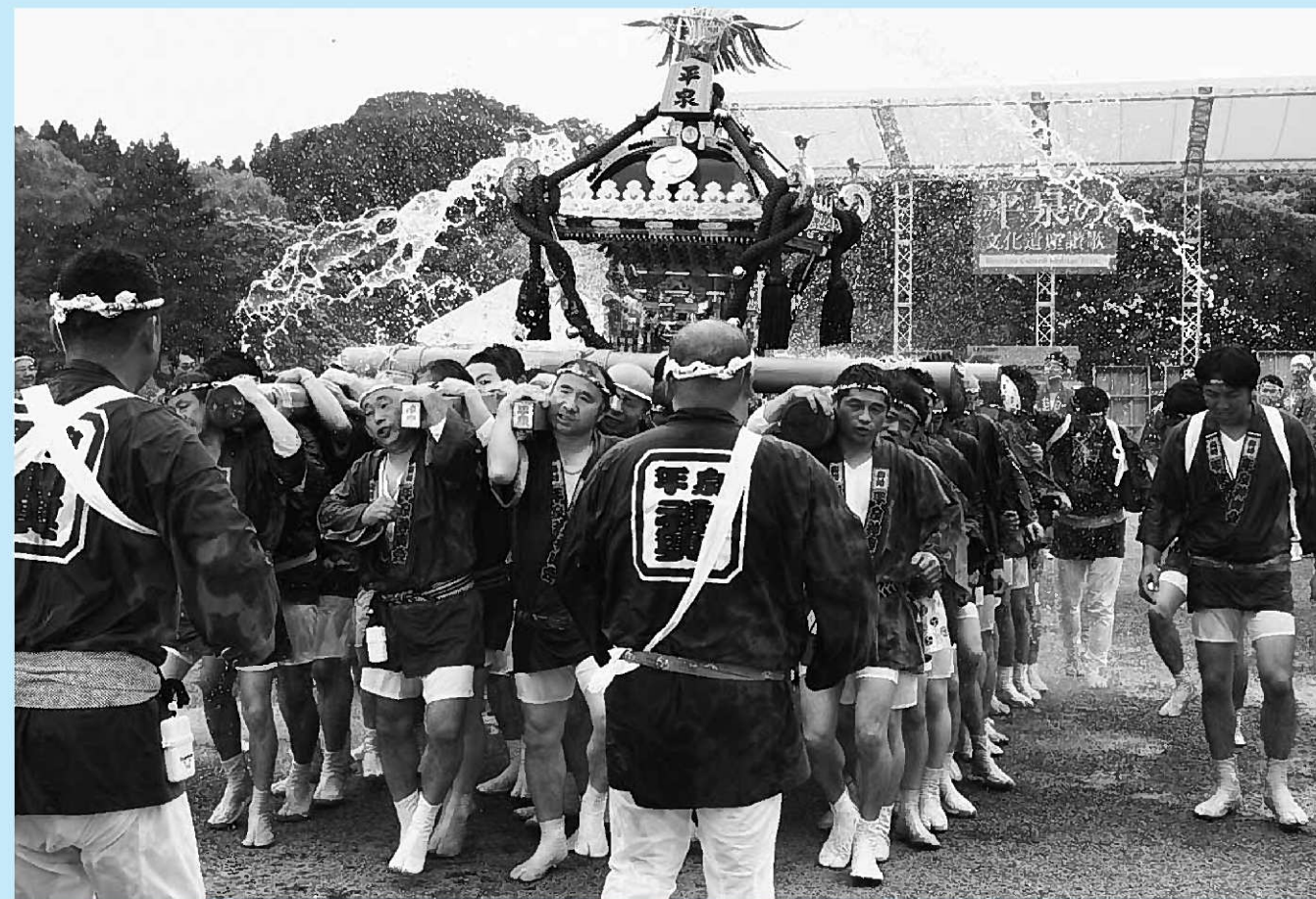
▲町中に「ワッショイ！」の大きな掛け声がこだました