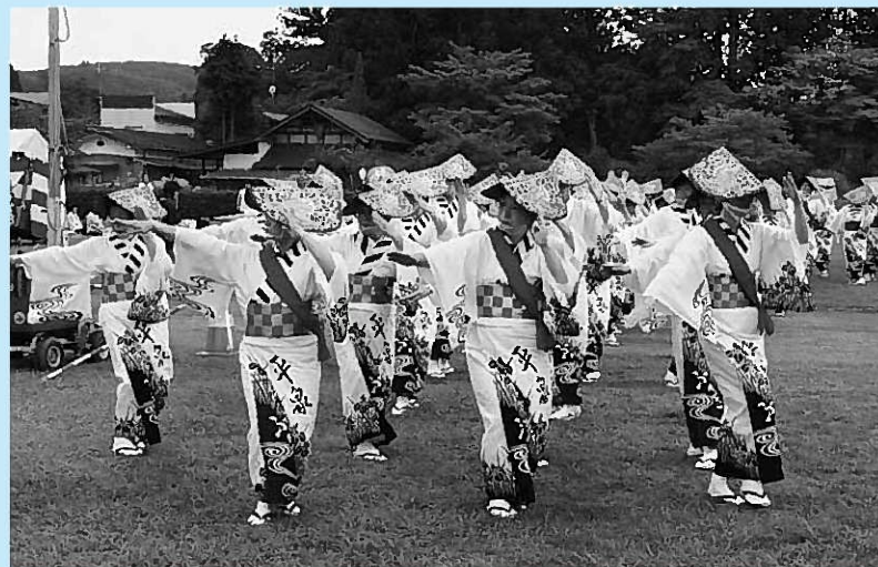
町内女性団体による平泉ふるさと踊り=2日目