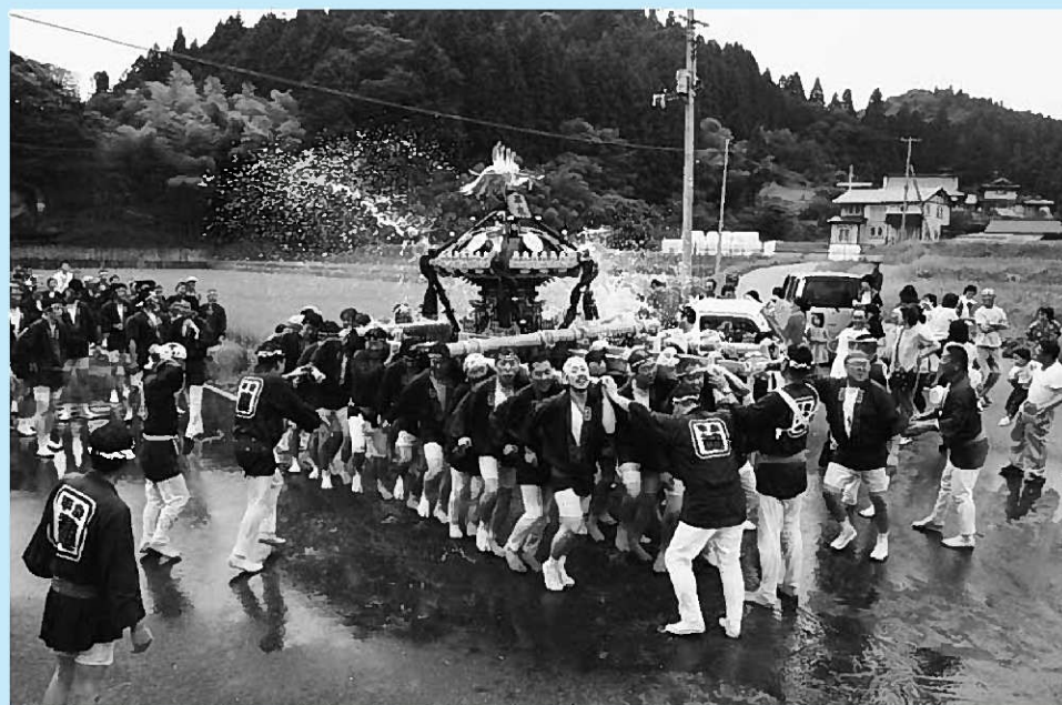
▲下達谷、上平泉地区で行われた地域宵宮

平泉水かけ神輿渡御(平泉総社神輿奉賛会、平泉神輿会主催)が7月20日、旧観自在王院庭園一中尊寺金色堂間で繰り上げられました。世界遺産登録を祈念して3日間の日程で開かれた「平泉の文化遺産讃歌」を締めくくりました。渡御には町民の皆さんをはじめ、応援に駆けつけた富岡八幡宮神輿総代連合会など総勢約300人が参加。町内のコースを勇壮、豪快に練り歩きました。渡御中、沿道からは「清め水」が容赦なく浴びせられ、町中には「ワッショイ！」という大きな掛け声がこだまし、古都平泉は活気に包まれました。また前日の19日には、旧観自在王院庭園で宵宮が、下達谷、上平泉地区で地域宵宮が開催されました。