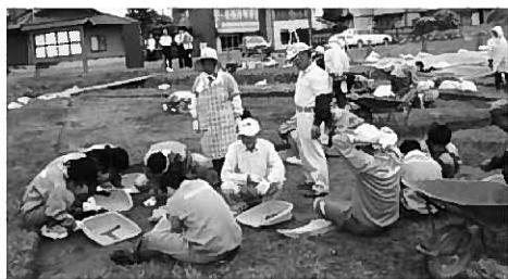
1年生発掘体験の様子