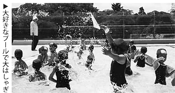
▶大好きなプールで大はしゃぎ