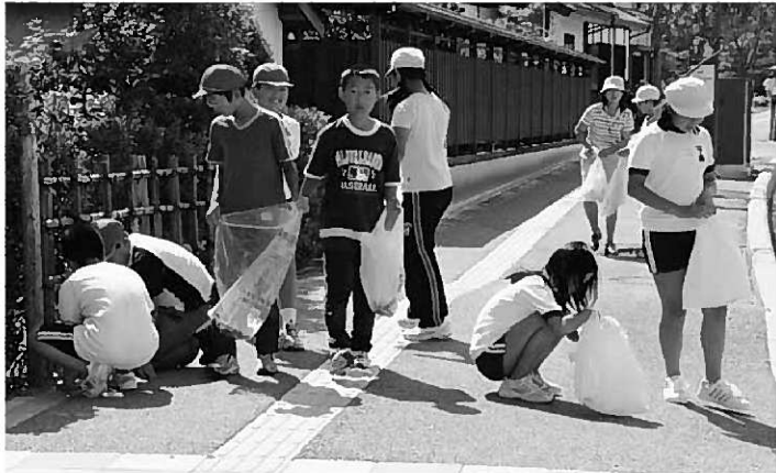
イコモスの現地調査に向けた平泉小児童による毛越寺線歩道のごみ拾い=昨年8月

⑥ その場合、世界遺産登録の可否については、平成23年の世界遺産委員会で決定されることとなります。