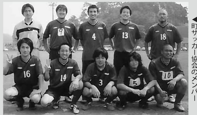
▶町サッカー協会のメンバー