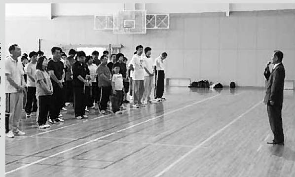
▶優勝を胸に望んだふるさとオリンピック開幕式