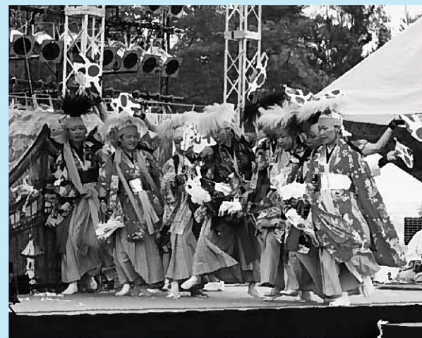
達谷窟毘沙門神楽の舞=2日目