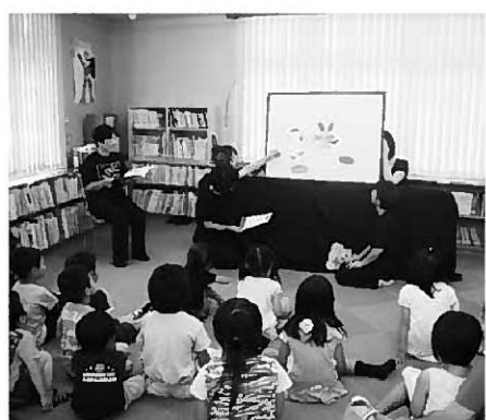
「どんぐり」によるおはなし会