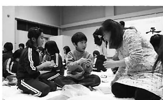
指導を受けながらかわらけを作る児童

ご意見 広報は自分が住む平泉のことだからので毎月読んでいます。これからも各コーナーを盛り上げていってほしいです。ペンネーム・Sakura ありがとうございます！これからも、より親しみやすい広報誌を目指して頑張ります！ 【お知らせ】広報クイズの景品は、昨年5月号から平泉町共通商品券に変わりますよ！