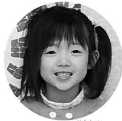
スケート選手 吉田ひとみ