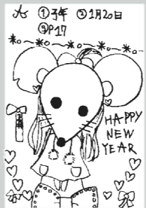
▲ペンネーム・ネコ！♡