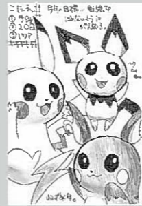
▲ペンネーム・千夜