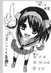
▲ペンネーム・海隆