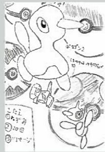
▲ペンネーム・亜智