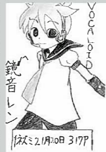
▲ペンネーム・糸色望