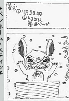
ペンネーム・ステイチ