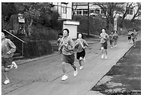
部対抗駅伝の様子

生チームが優勝し、まだまだ下級生には負けたくないぞ、という意地を見せました。 1月16日からは私立高校の推薦入試や一般入試が始まります。 3年生には、今回の駅伝の意地をぜひとも今後の高校入試で発揮してほしいと思います。