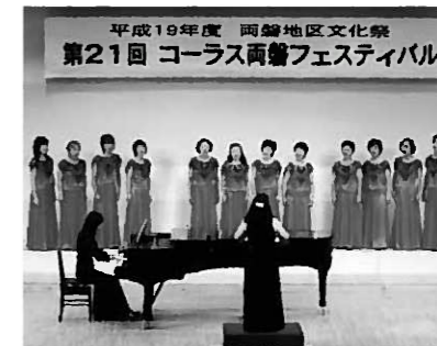
両磐地区文化祭にも出場しました