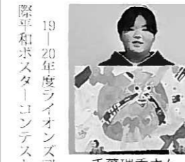
19-20年度ライオンズ団 際平和ボスターコンテスト