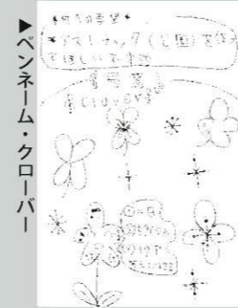
ペンネーム・クロイバー