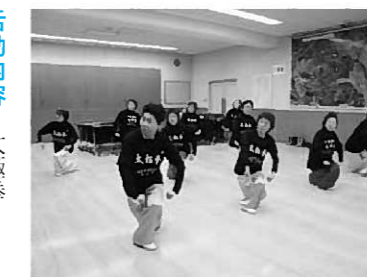
太極拳は心と体をいやします