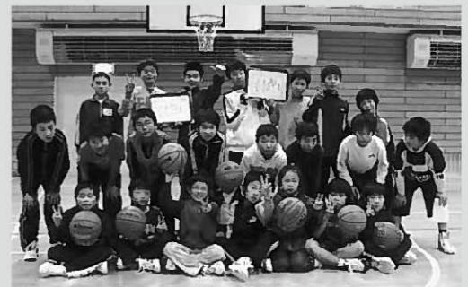
県大会への出場を決めた平泉町ミニバススポ少

区の4年連続単独優勝を阻む形となりました。総合成績表は2月24日の「生涯学習町民の集い」で行われます。大会結果は次の通りです。 ◎壮年ソフトボール競技 【準決勝】 13区 2-0 10区 12区 2-1 11区 【決勝】 13区 2-0 12区 ※数字はセットカウント 【成績】 ▽優勝 13区▽準優勝 12区▽第3位 10区、11区 ◎バスケットボール競技 ▽優勝 11区▽準優勝 7区▽第3位 2区、8区