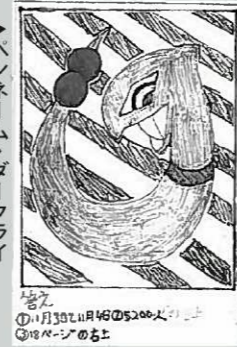
ペンネーム・ダークライ