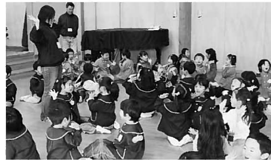
在園児と一緒に楽しく遊びましょう

ルエンザ予防など季節の話題を織り交ぜたミニ健康教室を行っています。 給食試食会や読み聞かせなど楽しい催しも 子育て支援センターでは10月から、新しい企画として給食の試食会と絵本の読み聞かせを始めました。 給食試食会では、在園児と一緒に親子で給食を食べました。みんなと一緒に給食を食べれば、好き嫌いがあっても頑張つて食べることが出来ます。また普段家族と食事をすることが多い子も、園児と一緒ににぎやかな中で給食を食べることは貴重な体験にもなりました。