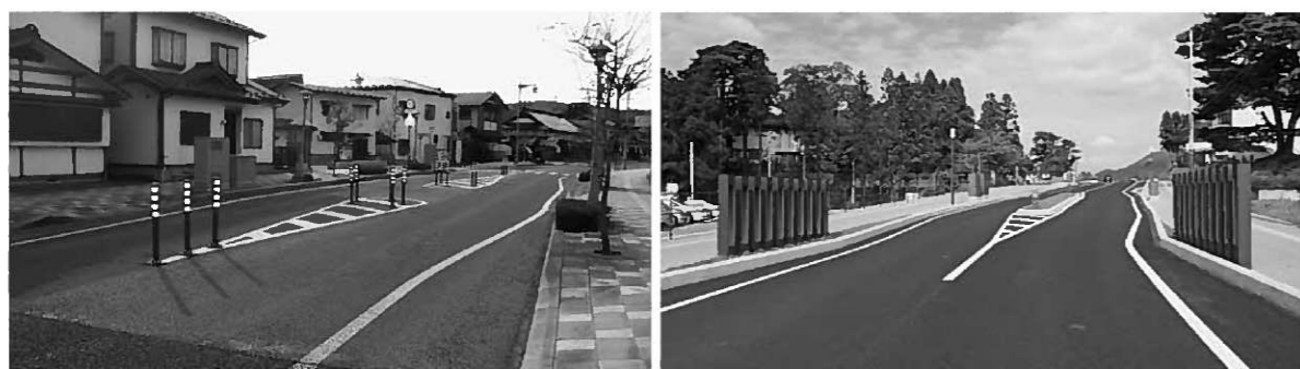
◀毛越寺線の平泉中学校入り口部分(左写真)と毛越寺町営駐車場前部分(右写真)