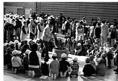
もち花飾りの様子

よへ学んで元気遊び 社会のために働く 明けましておめでとうございませう。 昨年は、家庭と地域と学校は子育てのパートナーという考えの下、学校から発信した内容についてしっかりとご理解くださり、同じ方向に向かってご協力を頂きましたことに心から感謝と御礼を申し上げます。ありがとうございました。おかげさまで、子どもたち