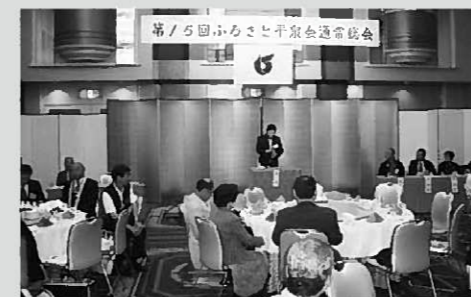
昨年6月に開かれたふるさと平泉会総会

新年に当たり、ふるさと平泉会のご多幸と平泉町のますますのご発展を心よりお祈り申し上げます。