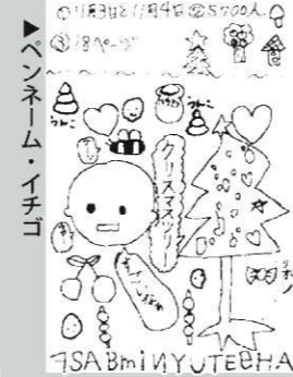
ペンネーム・イチコ