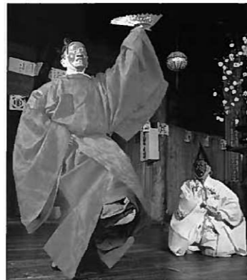
毛越寺延年「京殿有吉」