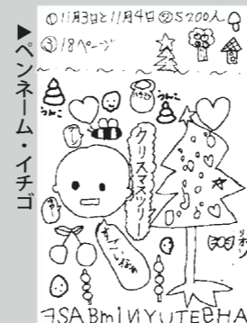
ペンネーム・イチゴ