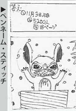
ペンネーム・ステイツチ