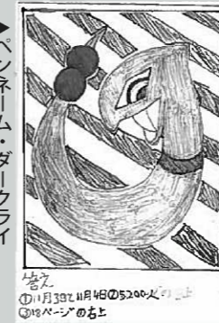
ペンネーム・ダイクライ