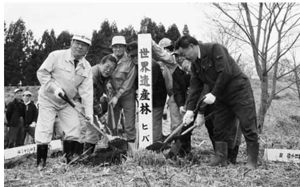
昨年4月に字大沢地内で行われた世界遺産林の植樹