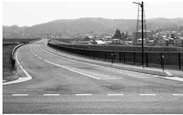
整備が完了し通行可能となった町道中学校線