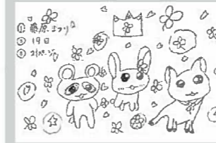
▲ペンネーム・はーちゃん