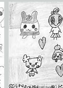
▲ペンネーム・まめっち