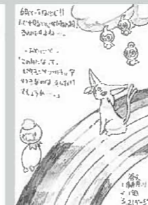
▲ペンネーム・千夜