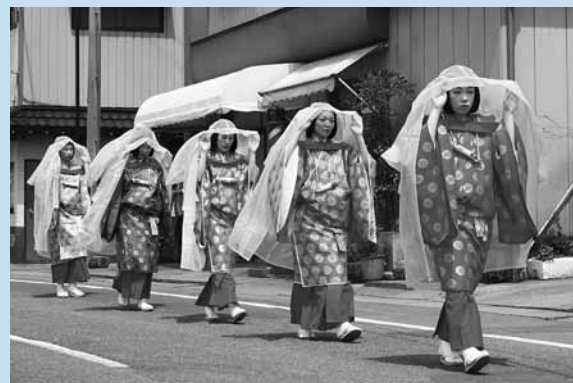
あてやかな藤原家侍女の一行