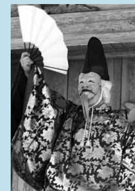
中尊寺古実式三番