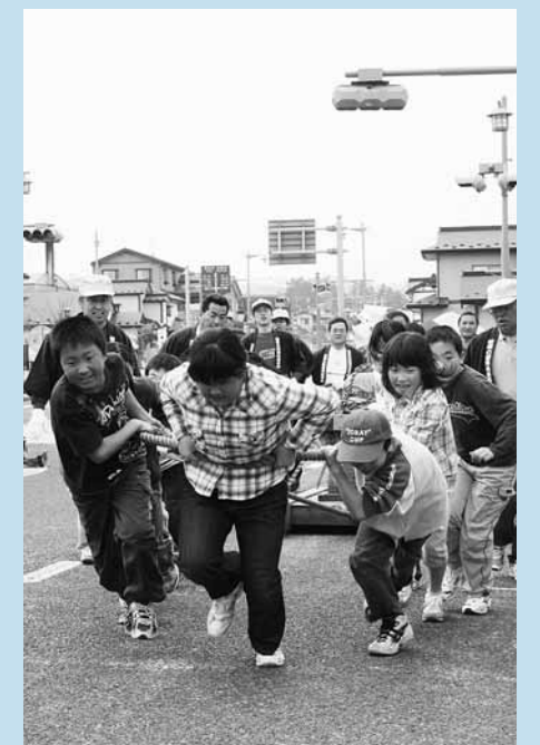
町内小学生11チームで競った弁慶力餅そり引き大会