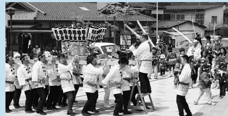
勇ましい掛け声を響き渡らせながら町内を練り歩いた13区睦会